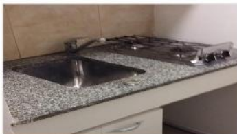
SAN NICOLAS Monoambiente

Monoamb apto profesional, 22 m2 cub, bajas expensas, a metros avda corrientes, 9 de Julio. (DEPA2054)