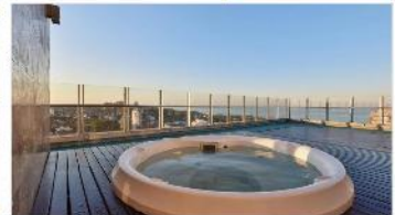
OLIVOS Depto 3 amb

Rosales Park Tower, 2 dorm, balcon, cochera cub., 3 baños, gym, seg, laundry, piscina, SPA. (DEPA2109)