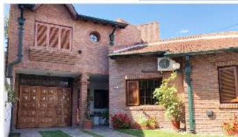
BARRIO PARQUE Chalet 4 Amb

Chalet 4 amb s/lote 350m2, con 218m2 cub. Amplio jardin piscina quincho garage + cochera, venta con renta (DEPA1917)