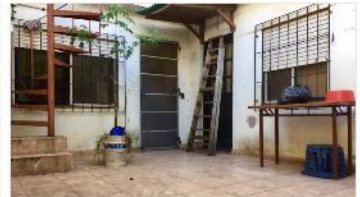
VILLA MARTELLI Block c/ 2 unidades

Block con 2 unidades de 3 amb (PB y PA), patio, 80m2 cub, , muy buena ubic, a metros de av Mitre y Panamericana, sin exp, (DEPA1684)