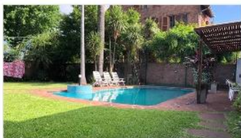
BARRIO PARQUE Chalet 3 Amb.

Chalet 3 amb ideal ampliacion s/lote 375m2 garage + cochera, jardin, piscina climatizada, (DEPA1793)