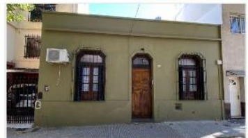
VILLA URQUIZA Casa 4 amb

Casa 4 ambientes s/lote 8,45x11 95m 2 cubiertos, 3 dormitorios (1 en planta alta), patio, 2 baños, terraza, (DEPA2267)