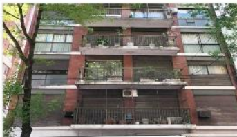
BELGRANO Depto 2 Amb.

48m2 CUB + Balcon , muy luminoso, exc. Estado y ubicación a metros avenida (DEPA1942)