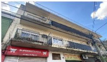
VILLA MARTELLI Depto 2 Amb.

Departamento 2 amb, sobre Av Laprida (alt. W.morris), 35m2 cub, bajas expensas, balcon, (DEPA2386)