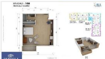
VILLA MARTELLI CAMPUS NORTE

EN PESOS!! A ESTRENAR Depto 45m2 cub. + balcon vista jardines, amenities seg – gym – office - piscina. (DEPA1985)