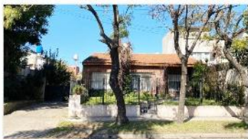
BECCAR Block 2 casas

Apto multifamiliar con 2 chalet 3 y 4 amb sobre lote 915m2, piscina jardín garage + cochera hermosa ubicación y estado (DEPA2358)