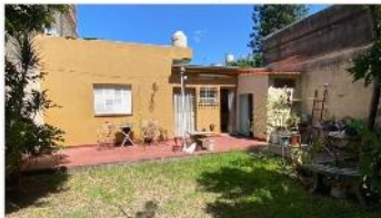
VILLA MARTELLI Casa 3 amb

Casa 3 amb con gran jardín, 236m2 totales, gge, 2 dorm, ideal ampl, exc ubicación, a metros de avenida, (DEPA2452)