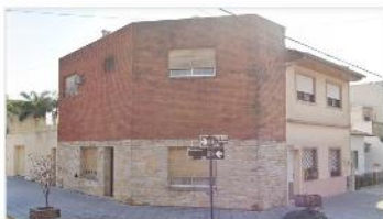
VILLA MARTELLI Block 2 casas 3 amb

Block apto multifamiliar con 190m2 cubiertos s/lote 230m2 patio garage, entrada independiente, exc estado (DEPA2401)