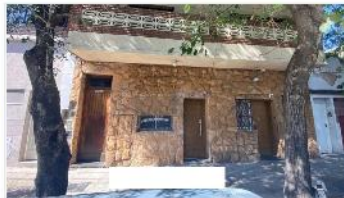
VILLA MARTELLI 2 PH Monoamb.

Block 2 PH Monoamb, sin exp, se pueden unific y quedarían c/ 3 amb, 40m2 Cub, Doble Entr Independe Ideal pequeño inver / Vivi; (DEPA2370)