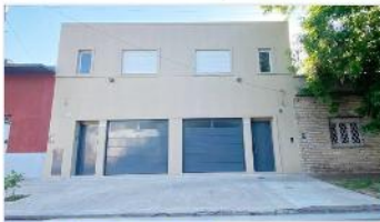
VILLA MARTELLI Duplex 4 Amb.

A ESTRENAR Duplex 4 amb, 100m2 cubiertos, jardín, cochera, 3 dormitorios. (DEPA2165)