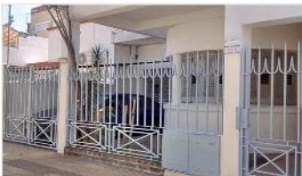
FLORIDA M PH 4 Amb

PH Independiente 4 ambientes, 190m2 total, a metros de avenida maipu y melo, no paga expensas (DEPA2064)