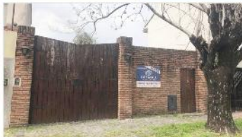
BARRIO CALESITA TERRENO 303 m2

Lote 8,66x35 (303m2) con quincho y piscina, a metros av mitre , zonificacion r2, fot 1, apto vivienda multifamiliar. (DEPA1923)