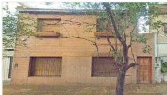
FLORIDA M Chalet 4 amb

Chalet 4 amb a metros avenida Maipu y San Martin, 160m2 cubiertos, jardin, piscina, 3 dorm, 2 baños (DEPA2299)