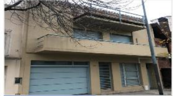
VILLA URQUIZA PH 3 ambientes

PH 3 amb con patio, ubicado en planta baja, exc ubicación, a metros de avenida, 57m2 cubiertos, bajas expensas, (DEPA2089)