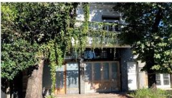
VILLA MARTELLI PH 4 ambientes

PH 4 amb en PA, 75m2 cub + 115m2 descub, refaccionado, 3 dorm, patio tza, exc ubicación, a metros de avenida y estación fcc, (DEPA2172)