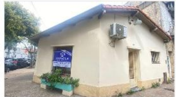
FLORIDA PH 2 Amb

PH 2 ambientes en planta baja y a la calle, 45m2 cubiertos, refaccionado, proximo colegio y maternidad, (DEPA2470)