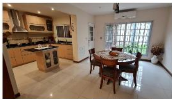
VILLA MARTELLI Chalet 5 Amb

Chalet 5 amb s/lote 170m2 con 240m2 cub. Escritorio con entrada indep. 3 dormitorios 4 baños jardín garage quincho (DEPA2367)