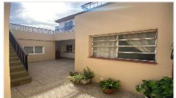
FLORIDA Block 2 PH de 3 Amb.

Block compuesto por 2 unidades con 3 ambientes cada uno, 97m2 cubiertos, patio, terraza. (DEPA2427)