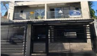
VILLA MARTELLI Depto 2 Amb.

Dpto 2 amb + balcon y cochera, 10 años antig. 55m2 cub. , muy luminoso, exc. Estado y ubicación (DEPA2315)