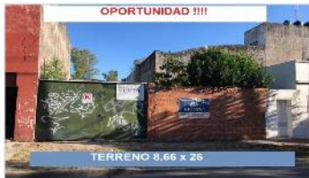
VILLA MARTELLI TERRENO 225 m2

Terreno 8,66x26 (225m2) zonificacion I1, FOT 1,2, Apto vivienda/industria. (CD021348)