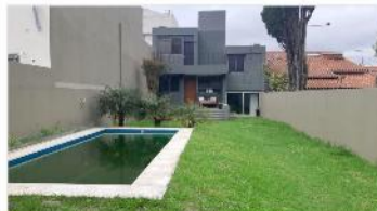
FLORIDA M Chalet 5 Amb.

Chalet 5 amb 6 años antigüedad sobre lote 433m2, piscina jardín cochera hermosa ubicación y estado (DEPA1670)