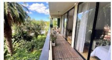
TIGRE Depto 2 Amb.

Departamento con 2 amb 44m2 cub. + balcon exc. Estado y ubicación, vista jardines, amenities quincho y piscina. (DEPA2306)