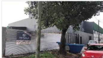
CARAPACHAY TERRENO 300 m2

Terreno 10x30 (300m2) edifcs hasta 300m2 a mts AV MITRE , ZONIFIC R2, FOT 1, APTO VIVIENDA MULTIFAMILIAR / DEPOSITO. (DEPA2096)