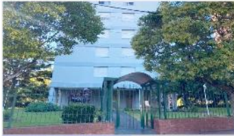
BARRIO PARQUE Depto 3 Amb.

57m2 CUB. Muy luminoso, hermosa vista , ascensor, jardín perimetral, bajas expensas (depa2489)