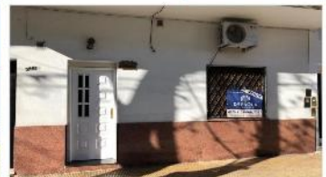
VILLA MARTELLI PH 3 Amb

PH 3 Ambientes a metros avenida, refaccionado en su totalidad, 55m2 cubiertos, 2 dormitorios, baño completo, patio, lavadero , (DEPA1722)