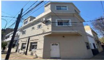
VILLA MARTELLI PH 4 Amb.

PH 4 amb PA, a mts avenida 136m2 cub, quincho, 3 dorm, excelente ubicación, refaccionada, (DEPA2376)