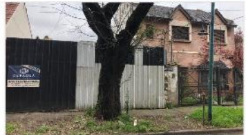
MUNRO TERRENO 300 m2

Terreno 8,66x34 (300m2) edifcs hasta 300m2 a mts Av Mitre , zonific R2, FOT 1, apto vivienda multifamiliar / deposito. (DEPA2131)