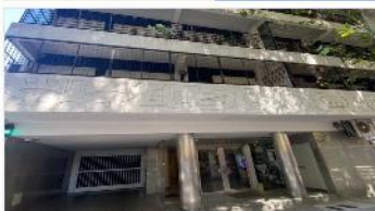
CENTRO Depto 2 Amb.

Planta baja- apto profesional 50m2 cub. 1 dormitorio, bajas expensas, a metros avenida optimos medios transporte (DEPA2465)