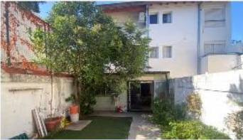
SAAVEDRA PH 2 Aamb

PH 2 Ambientes con jardín, excelente ubicación, a metros de avenida, 70m2 cubiertos, quincho, bajas expensas, (DEPA1579)