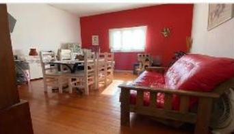
VILLA MARTELLI PH 3 amb

PH 3 Amb en PA, refaccionado, terraza, 95m2 cubiertos, muy buena ubicacion; 2 dormitorios, lavadero, (DEPA2326)