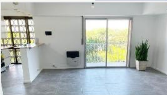
BARRIO PARQUE Depto 3 Amb.

Refaccionado 2 dormitorios 58m2 cub + muy luminoso, exc. Estado y ubicación barrio residencial (DEPA2257)