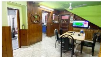
VILLA MARTELLI PH 4 Amb

PH 4 ambientes, 72m2 cubiertos, ubicado sobre Boulevard Cetrángolo, Hermosa Ubicación, sin expensas, (DEPA2383)