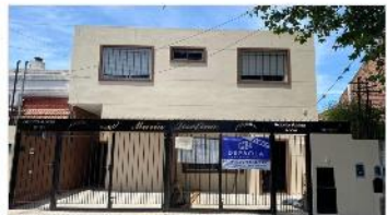
FLORIDA Casa 4 Amb.

Casa a estrenar 4 amb jardin piscina 130m2 cub. 3 dormitorios 3 baños ULTIMA UNIDAD! (DEPA2318)