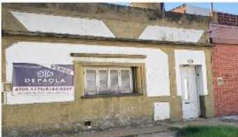
VILLA MARTELLI Casa 3 Amb

Casa a mejorar con 3 amb, lote 95m2 con 70m2 cubiertos, 1 planta, terraza, patio, a metros Av Laprida. (DEPA2058)