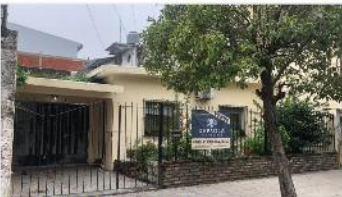
VILAL MARTELLI Casa 5 Amb.

Casa 5 ambientes, lote 10x20 con 130m2 cubiertos, patio, Cochera, apto multifamiliar, (DEPA2053)