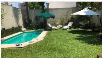
BARRIO PARQUE Chalet 5 Amb

Chalet 5 amb refaccionado s/ lote 320m2 con 350m2 cub. , piscina jardín galería garage, hermosa ubicación y estado . (DEPA1798)