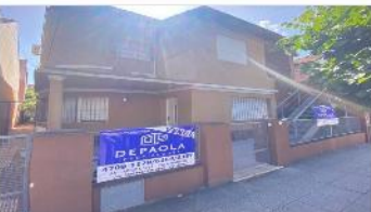
FLORIDA Block 2 ph de 4 amb

Block apto multifamiliar 2 unidades con 4 amb, 210m2 cubiertos, a metros avenida San Martin (DEPA2436)