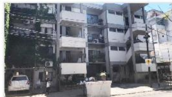
SAN ANDRES Depto 3 amb

Departamento 65m2 cub. + balcon 2 dormitorios, bajas expensas, optimos medios transporte. (DEPA1951)