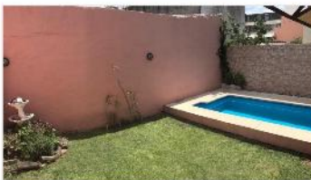
VILLA MARTELLI Casa 4 Amb.

Casa 4 ambientes en lote 8,66x17,32, 115m 2 cubiertos, jardín, galería, piscina, terraza (DEPA2013)