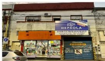
VILLA MARTELLI Block 4 unidades

Block compuesto por local + deposito + 2 unidades 3 amb. c/u con 280m2 cub. Y lote 300m2 ubicado sobre Av Laprida (DEPA2309)