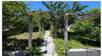
FLORIDA M Block 2 ph 3 amb

Block compuesto por 2 unid con 3 ambientes cada uno, gran jardin , 177m2 cubiertos + 200m2 libres. OPORTUNIDAD (DEPA2203)