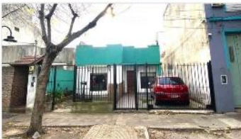
FLORIDA TERRENO 375 m2

Ideal emprendimiento h/ 6 unid! Lote 8,66x44 (375m2) edificables hta 412m2 a mts Av Mitre , Zonific R3, FOT 1,1, Apto vivi multifam / deposito. (DEPA2348)