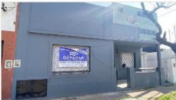
VILLA MARTELLI Casa 3 Amb

Casa 3 amb tot indepen, jardin y terraza, a metros de avenida laprida; refaccionado, 2 dorm, lavadero, cocina independiente, (DEPA1961)