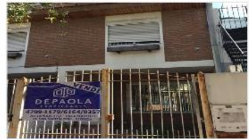
VILLA MARTELLI Duplex 4 Amb

Duplex 4 ambientes, 100m2 cubiertos, patio, cochera, hermosa ubicación. (DEPA2313)