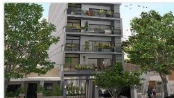
SAN MARTIN Depto 2 Amb.

2 amb 43m2 cub. A estrenar, bajas expensas, a metros avenida – consulte mas ambientes!. (DEPA2246)