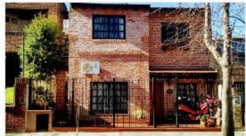
OLIVOS Chalet 4 Amb.

Chalet 4 amb a metros avenida maipu y parana, 150m2 cubiertos, jardin, piscina, galeria 3 dormitorios, 2 baños (DEPA2294)