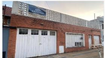
VILLA MARTELLI Casa 4 amb + Local

Casa 4 ambientes sobre lote 319m 2 cubiertos, cochera pasante, jardín, 2 baños a metros avenida (DEPA2296)