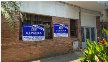
FLORIDA PH 2 ambientes

PH 2 ambientes en planta baja y a la calle, 37m2 cubiertos, ubicado a metros de estacion fcc y shopping DOT, (DEPA2219)