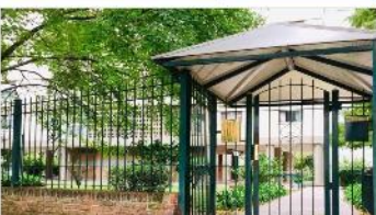
BARRIO PARQUE Depto 3 Amb.

3 Dormitorios , 65m2 balcon muy luminoso, cochera, vista abierta. (DEPA1716)