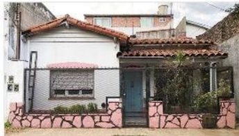
MUNRO PH 3 Amb

Ph 3 ambientes en pb y a la calle, 80m2 cubiertos + patio y terraza, muy buena ubicación, a metros de Panamericana, sin expensas, (depa2457)