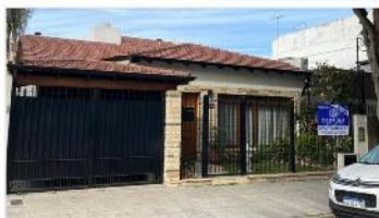
BARRIO PARQUE Chalet 5 Amb

Apto multifamiliar 2 chalet con 3 y 4 amb s/lote 300m2, con 270m2 cub. Jardin quincho garage exc. estado (depa2321)