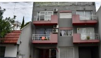
VILLA URQUIZA Monoambiente

40m2 cub + balcon, a metros avenida, muy luminoso, cochera cubierta, exc. Estado. (DEPA2476)