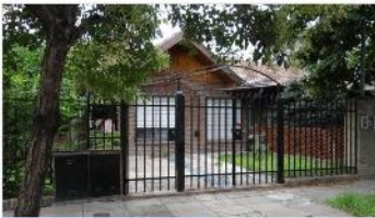
CARAPACHAY Chalet 4 Amb.

Chalet 4 ambientes con 70m2 cubiertos, patio, cochera, (DEPA2396)