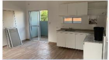
TRES DE FEBRERO Depto 3 Amb.

55m2 CUB. A ESTRENAR, detalle terminación , balcón, bajas expensas , prox estacion FFCC (DEPA2184)