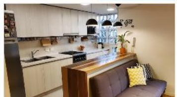
BARRIO PARQUE Depto 4 Amb.

El más lindo!! Refaccionado , 3 dormitorios, balcon , cochera, piso madera, DEPA2273)