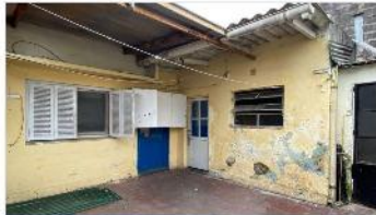
VILLA MARTELLI PH 2 Amb.

PH 2 Ambientes sobre Avenida Laprida (altura Chile) a metros de Avenida Mitre y CABA; Patio, Espacio aéreo propio, sin Exp (DEPA2121)