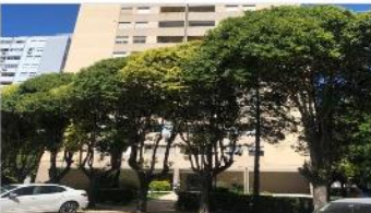
BARRIO PARQUE Depto 3 Amb.

50m2 CUB + Balcon , a metros CABA, excelente estado, muy luminoso, bajas expensas (DEPA1958)