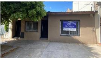
VILLA MARTELLI Casa 3 Amb

Casa 3 ambientes, lote 8,66x17, 80m2 cubiertos, jardín, terraza, ideal ampliación, a metros Avenida Mitre y Laprida. (DEPA2474)