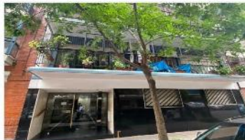
ALMAGRO NORTE Depto 5 amb

Dpto 3 dormitorios + dependencia servicio, balcon corrido, excelente ubicación, 80m2 cub. (DEPA2483)