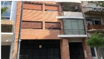
VILLA URQUIZA Depto 3 amb

Palier privado, cochera, balcon, 72m2 cub, 2 baños, 2 amplios dormitorios excelente estado y ubicación (DEPA2154)