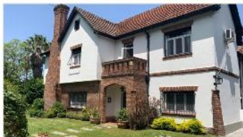
FLORIDA M Chalet 6 Amb

Chalet 6 amb estilo ingles refaccionado sobre lote 1.414m2 con 500m2 cub. , piscina jardín galería gge, a mts Av libertador (DEPA1831)