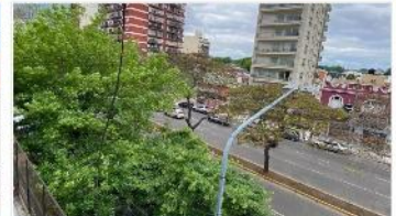
LA LUCILA PH 4 Amb

PH 4 ambientes, 115m2 cubiertos + terraza, ubicado sobre avenida Maipu y Roma, Hermosa Ubic, sin expensas, (DEPA2407)