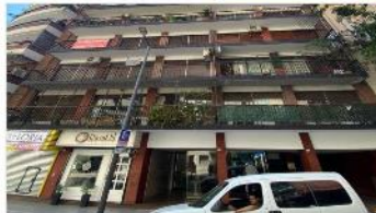
RECOLETA Depto 5 amb

Piso 150m2, 4 dormitorios + dependencia, palier privado, cochera cub., 3 balcones, 3 baños, Juncal y Talcahuano (DEPA2462)