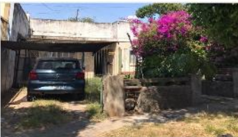
VILLA MARTELLI Casa 3 Amb

Casa a mejorar 3 ambientes, lote 280m2, 78m2 cubiertos, cochera, patio, terraza. (DEPA2464)