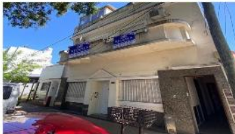
VILLA MARTELLI PH 6 Amb.

PH 4 amb en PA, 226m2 cub + 200m2 descubs, refaccionado, patio qcho terraza, exc ubic, a mts de avenida y estación fcc, (DEPA2412)