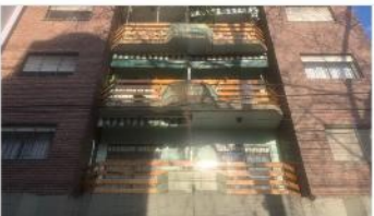
SAN MARTIN Depto 3 Amb.

60m2 CUB + Balcon , muy luminoso, exc. Estado y ubicación (A METROS UNSAM) (DEPA2360)