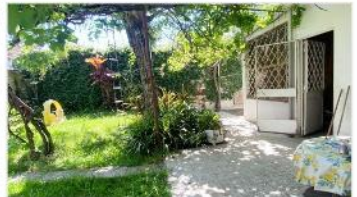
VILLA MARTELLI Casa 3 Amb.

Casa 3 ambientes, lote 300m2, 108m2 cubiertos, cochera, jardín, 2 dormitorios, terraza, IDEAL AMPLIACION. (DEPA2417)