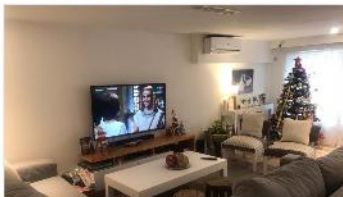
SAN ISIDRO Chalet 5 amb

Chalet 5 amb refaccionado con 230m2 cub. 3 dormitorios garage 2 autos jardin piscina (DEPA1590)