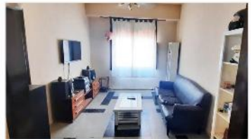
SAAVEDRA PH 2 Amb

PH 2 Amb, 50m2 cub, bajas exp, muy buena ubic, posee Living Cdor, Cocina Independiente, Dormitorio, Balcon; (DEPA2434)