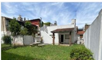
BARRIO CALESITA Chalet 3 amb

Chalet 3 ambientes con terreno 300m 2 , 124m 2 cubiertos, garage, terraza, a metros Avenida Mitre, (DEPA2416)