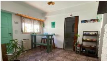
VILLA MARTELLI PH 3 Amb

PH 3 amb muy buen estado, 55m2 cubiertos, , muy buena ubicación, a metros de avenida mitre y caba, sin expensas, (DEPA2448)