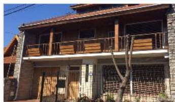
BARRIO PARQUE Chalet 6 Amb

Chalet 6 amb s/lote 314m2 con 244m2 cub. 5 dormitorios jardin garage (CD02107)