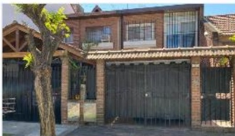
BARRI PARQUE Chalet 4 amb

Chalet duplex 4 ambientes 122m 2 cubiertos, 3 dormitorios, cochera cubierta, jardín, 2 baños, (DEPA2036)