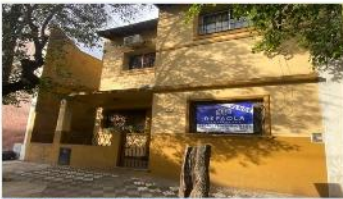
VILLA MARTELLI Casa 6 Amb.

Casa 6 ambientes con 160m 2 cubiertos, lote 8,66x17,4m, patio, quincho, terraza, a