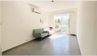
VICENTE LOPEZ Monoambiente

Hermoso dpto muy luminoso, sobre avda del Libertador (alt. Vial costero) 44m2 cub, bajas expensas (DEPA2208)