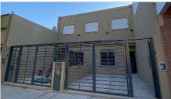
VILLA MARTELLI Casa 4 Amb.

Casa 4 ambientes 110m 2 cubiertos, cochera2 baños a metros Avenida Mitre (DEPA2162)