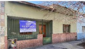
VILLA MARTELLI PH 3 Amb

PH 3 ambientes independiente, 80m2 cubiertos, patio y terraza, muy buena ubicación, a metros de avenida, sin expensas, (DEPA2347)