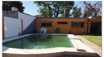
FLORIDA Casa 4 Amb.

Casa 4 ambientes, lote 300m2 con 130m2 cubiertos, jardín, piscina, quincho, (DEPA2249)