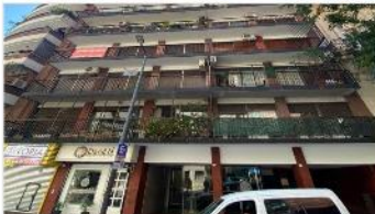
RECOLETA Depto 5 Amb.

Hermosa ubicación, 132m2 cub + balcon , dependencia servicio, cochera cubierta , muy luminoso (DEPA2462)