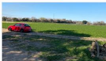
ESCOBAR CAMPO 37,5ha

Campo sembrado con alfalfa, 37,5 hectareas, acceso con asfalto mejorado, trifasica, excelente y rapido acceso (DEPA2359)