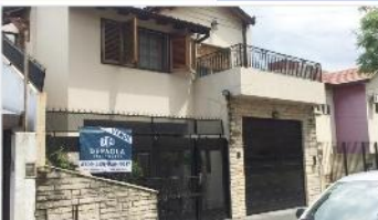
FLORIDA Block 2 unidades

Chalet 5 amb apto multifamiliar s/lote 433m2, con 300m2 cub. Amplio jardin piscina quincho garage, mts avenida (DEPA1609)