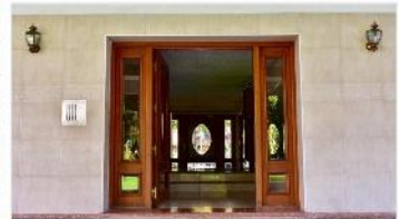
BARRIO PARQUE Depto 4 amb

Dpto 3 dormitorios , balcon , 65m2 , cochera, excelente ubicación. (DEPA1667)