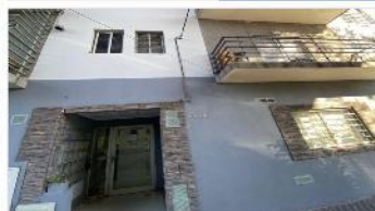
VILLA BALLESTER Depto 2 Amb.

A metros avenida, 35m2 cub. 1 dormitorio, balcon, exc. Ubicación y estado optimos medios transporte. (DEPA2316)