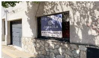
VILLA MARTELLI Casa 3 Amb

Casa 3 ambientes, lote 8,66x16, 75m2 cubiertos, jardín, terraza, ideal ampliación, sobre Avenida Laprida. (DEPA2126)