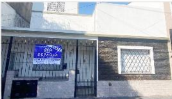
VILLA MARTELLI Casa 3 Amb

Casa 3 amb tota indepen, tza, a mts de av laprida; todos los servicios, 2 dorm, lavadero, cocina independiente, (DEPA2461)