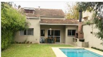
LA LUCILA Casa 6 Amb

Chalet 4 amb sobre lote 441m2, 3 dormitorios 2 baños piscina jardín garage hermosa ubicación y estado (DEPA2082)