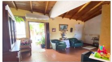
SAN MARTIN PH 4 Amb.

PH 4 Ambientes en planta alta sin expensas, 75m2, balcon y terraza, ubicado sobre centro comercial, (DEPA21626)