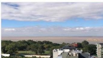
VICENTE LOPEZ Depto 3 Amb.

Vista al río!!! Refaccionado, 2 dormitorios, balcon con cerramiento, muy luminoso, (DEPA2034)