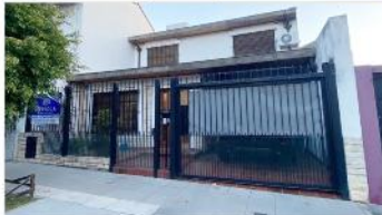
FLORIDA Chalet 6 Amb

Chalet 6 amb con 190m2 cubiertos cochera, patio, 5 dormitorios, 2 baños (DEPA2307)