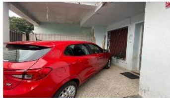
SAN MARTIN Block 2 ph de 3 amb.

Block compuesto por 2 casas a mejorar con 3 ambientes cada uno, lote 8,66x29 con 130m2 cubiertos, cochera, patio. (DEPA2217)