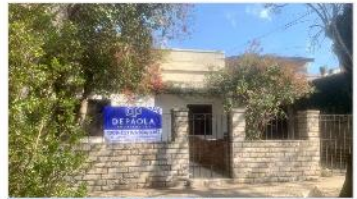
VILLA MARTELLI Block 2 ph de 3 amb

Casa apto multifamiliar, 232m2 cubiertos, patio, cochera, a metros Avenida Laprida. (DEPA2368)