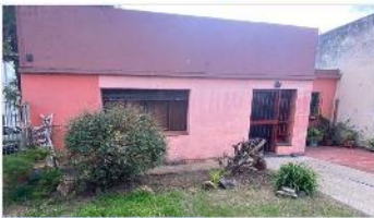
VILLA MARTELLI Casa 4 Amb

Casa 4 ambientes, lote 187m2 con 130m2 cubiertos, patio, cochera, ideal ampliación. (DEPA2319)