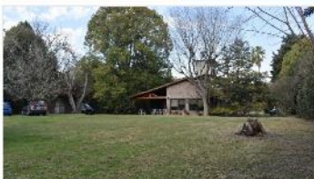
B° EL REMANSO Quinta

Terreno 3300m2 ,350m2 cubiertos, pileta 12x5, excelente acceso con asfalto, sin expensas, (DEPA2256)