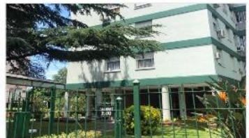
BARRIO PARQUE Depto 4 Amb.

3 Dormitorios 58m2 cub + muy luminoso, exc. Estado y ubicación barrio residencial (DEPA1957)