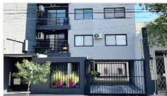
FLORIDA Depto 4 amb

2 años antigüedad, 2 dormitorios, 2 baños, cochera, balcon , 75m2 CUB, excelente ubicación,. (DEPA2400)