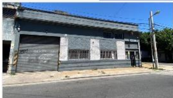
SAN MARTIN GALPON 720m2

Inmueble industrial con 720m2 cub, baño, vestuario y oficina, zona industrial , rápido acceso a CABA, entrada vehículo carga, (DEPA2238)