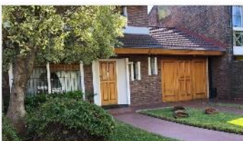
SAN ISIDRO Chalet 4 amb

Chalet 4 amb en zona "lomas", 180m2 cub. s/lote 400m2, garage + cochera pasante, jardin, piscina, exc. Estado (CD021406)