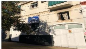
VILLA MARTELLI Chalet 5 Amb

Casa estilo frances con 5 amb, garage patio y terraza, 140m2 cubiertos, A metros Avenida Maipu. (DEPA1865)