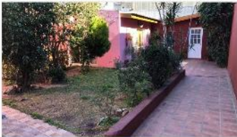
VILLA MARTELLI Casa 5 Amb.

Casa 5 ambientes, garage, quincho (puede funcionar como 2 ambientes independiente), 400m2 totales, (DEPA1743)