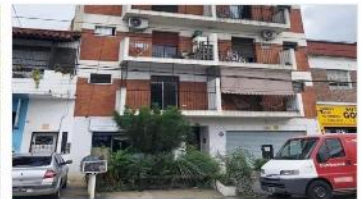
VILLA MARTELLI Depto 2 Amb.

2 amb, sobre avda Mitre, 41 m2 cub, bajas expensas, balcon a metros estacion FFCC "Padilla" (DEPA2357)