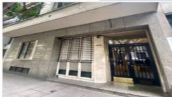
ALMAGRO Depto 3 Amb.

2 Dormitorios + dep. Servicio completa, 76m2 cub + balcon muy luminoso, 2 baños a metros plaza (DEPA2481)