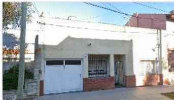
VILLA MARTELLI Casa 4 Amb.

Casa 4 ambientes, lote 10x20 con 141m2 cubiertos, patio, garage, quincho, terraza, (DEPA2017)