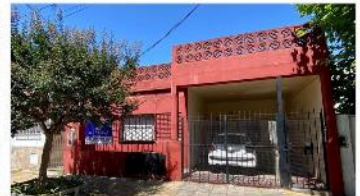
VILLA MARTELLI PH 3 Amb

PH 3 amb independiente, 250m2 total, garage + patio y terraza, muy buena ubicación, a metros de avenida, sin expensas, (DEPA2197)