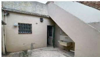
VILLA MARTELLI PH 3 Amb

Ph 2 ambientes en planta baja sin expensas, 135m2, patio y terraza, ubicado a metros de avenida Laprida, (depa2384)