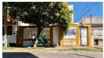
VILLA MARTELLI Casa 6 Amb.

Casa 6 ambientes apta multifamiliar (4 unidades) en lote 8,66x22 250m 2 cubiertos, (DEPA2041)