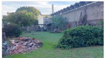
FLORIDA TERRENO 1050 m2

3 Lotes 10x35 (350m2) cada uno, se venden los 3 juntos (cada uno escritura indepen), zonific i1, fot 1,2, apto vivienda multifamiliar / galpon. (DEPA2062)