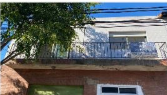
FLORIDA Block 3 amb + galpón

Block compuesto p/ 2 unidades, galpon 30m2 en planta baja + 3 ambientes en PA, entrada y escrituras independiente, (DEPA2338)