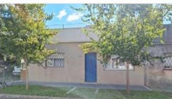
VILLA MARTELLI Casa 4 Amb.

Casa 4 amb a mts av, 84m2 cub + 60m2 descubiertos, lavadero cubierto, 3 dorm, excelente ubicación, refaccionada, (DEPA2279)