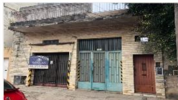
VILLA MARTELLI ALQUILER

Galpón / Deposito con baño y oficina, 320m2 cubiertos, techo losa, entrada vehículo carga, (DEPA2102)