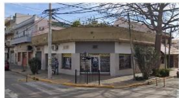
VILLA MARTELLI Block 3 locales + 4 amb

Block con 3 locales + 4 amb, 270m2 cubiertos, sobre avenida Laprida esq Colombia. OPORTUNIDAD (DEPA2455)