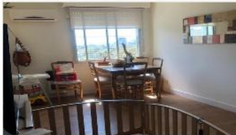
BARRIO PARQUE Depto 3 Amb.

57m2 CUB + Balcon, al frente excelente estado, refaccionado, bajas expensas (DEPA1931)