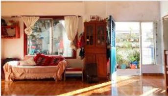
VILLA MARTELLI PH 3 Amb

PH 3 Ambientes en planta baja y a la calle, 58m2 cubiertos + patio de 23m2, muy buena ubicación, sin expensas, (DEPA2463)