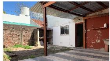
VILLA MARTELLI Chalet 3 Amb

Chalet 3 amb, lote 8,66x20, 75m2 cub, jardín, ideal ampliación, a metros Av Laprida. VENTA CON RENTA HASTA 2024. (DEPA2175)