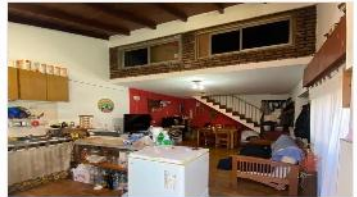
VILLA MARTELLI PH 3 amb.

PH 3 Ambientes 65m2 Ubicado a metros de Av Laprida (altura paraguay) y metros de CABA; Terraza, 2 dorm, sin Expensas (DEPA2282)