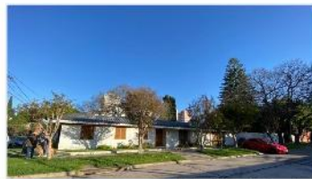
VILLA MARTELLI Chalet 5 Amb

Chalet 5 amb sobre 3 lotes con 735m2 totales, 3 dormitorios 3 baños gran jardín garage quincho (DEPA2161)