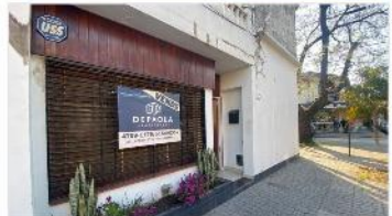
VILLA MARTELLI PH 3 Amb

PH 3 amb con patio y terraza, a metros de avenida mitre y laprida; excelente estado, 90m2 cubiertos, sin expensas, (DEPA2334)