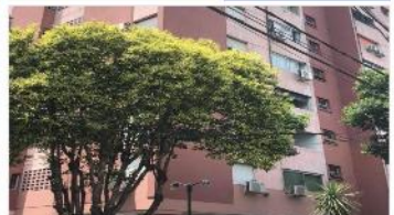
BARRIO PARQUE Depto 3 Amb.

Departamento 2 dormitorios completa, 56m2 cub + balcon muy luminoso, (DEPA1796)