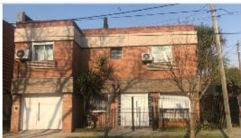
BARRIO PARQUE Chalet 5 amb

Chalet 4 amb refaccionado con 180m2 cub. 3 dormitorios garage 3 baños (DEPA1896)