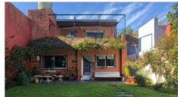
FLORIDA Chalet 4 amb

Chalet 4 amb a metros avenida mitre yPanamericana 200m2 cubiertos s/lote 266m2, jardin quincho 3 dormitorios. (DEPA2139)