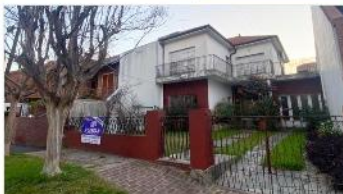
BARRIO PARQUE Chalet 5 amb

Chalet 5 amb con 212m2 cubiertos s/lote 326m2 gran jardin, 4 dormitorios, 2 baños cochera + garage (DEPA2346)