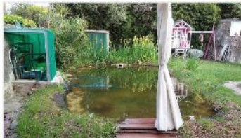
VILLA MARTELLI Chalet 4 Amb

Casa 4 ambientes, lote 300m2, 128m2 cubiertos, cochera, jardín, 3 dorm, refaccionada. Venta con renta hasta 2024. (DEPA1869)