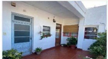
SAAVEDRA PH 3 Amb.

PH 3 amb en PA, 76m2 cub + 20m2 descub, lav cub, 2 dorm, excelente ubicación, a metros de avenida Balbín y Gral Paz, (DEPA1921)