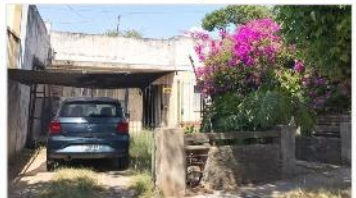
VILLA MARTELLI TERRENO 280 m2

Terreno 280m2 edificables hasta 336m2 zonificacion I1, FOT 1,2, Apto vivienda / industria. (DEPA2467)