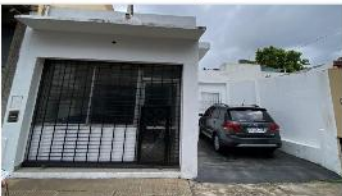
OLIVOS Block 2 unidad + Loc.

BLOCK Compuesto por local + 2 ambientes, cochera, espacio aereo propio, ubicado sobre Pelliza altura España (DEPA2405)