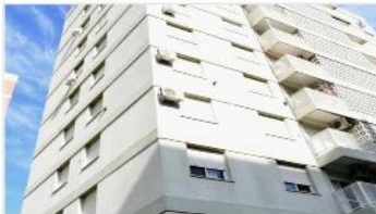
VILLA MARTELLI Depto 4 amb

Departamento 3 dormitorios, balcon, cochera, excelente ubicación, 60m2 cub. (DEPA1677)