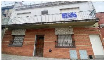
VILLA MARTELLI Block 2 PH con 3 amb

Casa 6 ambientes, apto multifamiliar, 160m2 cubiertos, patio, cada unidad posee 2 dormitorios, terraza, (DEPA2479)