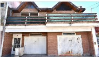
SAN MARTIN Casa 4 Amb.

Casa 4 ambientes sobre lote 311m 2 , 233m 2 cubiertos, cochera pasante, jardín, 3 baños, (DEPA2155)