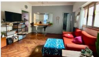
VICENTE LOPEZ PH 3 Amb

PH 4 amb a mts av Maipu, 82m2 cubiertos + 60m2 descubiertos, quincho, 2 dorm, excelente ubicación, refaccionada, (DEPA2362)