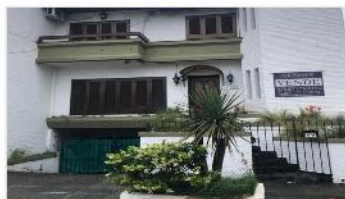
MARTINEZ Chalet 4 amb

Chalet 4 amb 211m2 cub. Garage + cochera, jardin, piscina, venta con renta H/2024 (DEPA1442)