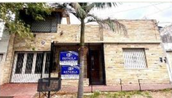
VILLA MARTELLI Casa 4 Amb

Hermosa Casa 3 dormitorios, Refaccionada, 135m2 cubiertos, Garage, Terraza. (DEPA2488)