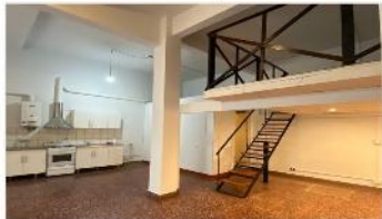
MUNRO PH 2 Amb

PH 2 Ambientes en planta baja con posibilidad de 3 ambientes, ubicado sobre avenida v. Sarfield, a metros de estacion FCCC (DEPA2437)