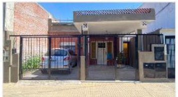
VILLA MARTELLI Casa 3 Amb

Casa 3 amb totindependiente, jardin y terraza, garage + cochera, a metros de avenida Laprida; 2 dormitorios, lavadero (DEPA2392)