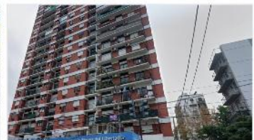
VICENTE LOPEZ Depto 2 amb

Refaccionado, hermosa vista al rio, balcon , 55m2 cub, cochera cub., a pasos del paseo costero. Acepta permuta (DEPA2003)