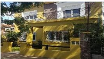
FLORIDA Chalet 4 amb

Chalet 4 amb con 200m2 cubiertos s/lote 242m2 gran jardin, piscina, 3 dormitorios, 2 baños (DEPA1661)