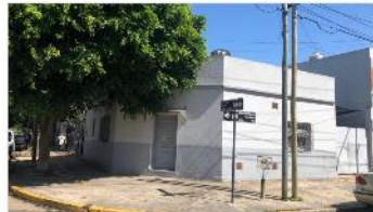
VILLA MARTELLI PH 3 Amb

PH 3 ambientes muy buen estado, 75m2 cubiertos + 115m2 descubiertos, cochera y terraza , totalmente independiente, (DEPA2031)