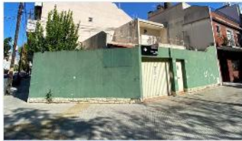
MONTE CASTRO Casa 4 Amb.

Casa 4 ambientes, 110m2 cubiertos, patio, cochera, hermosa ubicación, metros Alvarez Jonte. (DEPA2283)