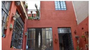
VILLA MARTELLI Dpto 5 ambientes

PH 5 amb 130m2 totales, refaccionado, 3 dorm, patio terraza, excelente ubicación, a metros de avenida, (DEPA2477)