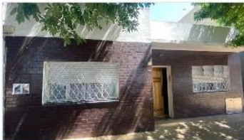
VILLA MARTELLI Casa 3 Amb

Casa 3 ambientes a metros de avenida mitre y estacion ffcc, 87m2 cubiertos + patio y terraza, muy buen estado, (DEPA2423)