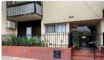
FLORIDA Depto 3 Amb.

Dpto 3 amb + balcon a metros avda san martin, 55m2 cub. , muy luminoso, exc. Estado y ubicación (DEPA2242)