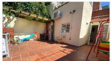
FLORIDA Casa 3 Amb

PH 3 ambientes con patio, a metros de Panamericana y Melo; excelente estado, 100m2 totales, DEPA2270)