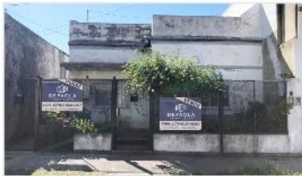
VILLA MARTELLI Block 2 PH de 3 amb

Casa apto multifamiliar, compuesto por 2 ph con 3 amb cada uno, lote 8,66x25, 150m2 cubiertos (DEPA1914)