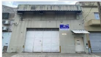
FLORIDA GALPON 796m2

Inmueble industrial con 796m2 cubiertos, lote 8,66x57, baño, vestuario y oficina, zona industrial , entrada vehículo carga, (DEPA2445)