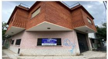
VILLA MARTELLI Block local + 4 amb

BLOCK LOCAL / DEPOSITO + 4 amb en PA, a mts avenida 206m2 cubiertos, terraza, todos los servicios, (DEPA2451)