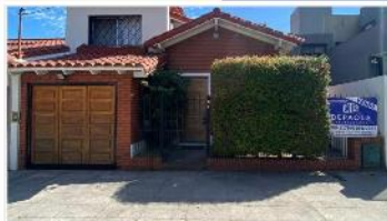
FLORIDA M Chalet 5 Amb.

Chalet 5 amb s/lote 433m2, con 220m2 cub. Amplio jardin piscina quincho 3 dormitorios playroom garage x 2 (DEPA2478)