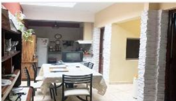
VILLA MARTELLI ph 3 Amb.

PH 3 ambientes en planta baja sin expensas, 75m2 cubiertos, terraza, refaccionado, , valor venta (DEPA2024)