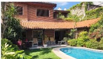
MARTINEZ Chalet 5 Amb

Chalet 5 amb s/lote 250m2 con 340m2 cub. 4 dormitorios 4 baños jardín garage piscina (CDO21221)