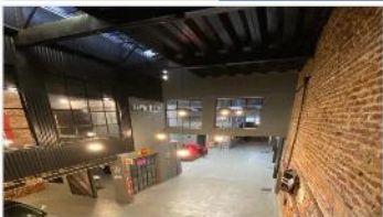
VILLA MARTELLI ALQUILER/VENTA

Inmueble industrial en exc estado con baño y oficina, 890m2 cubiertos, ideal salón ventas/showroom entrada vehículo carga, (DEPA2431)