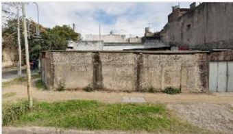
VILLA MARTELLI TERRENO 237 m2

Terreno 15x15 (237m2) edificables hasta 285m2 a mets av , zonificacion I1, FOT 1,2, Apto vivienda/industria. (DEPA2378)