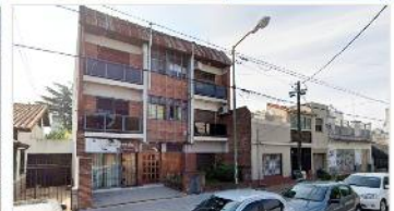
VILLA BALLESTER Depto 2 amb

Departamento 40m2 cub. + balcon 1 dormitorio, bajas expensas, a metros avenida optimos medios transporte. (DEPA1810)