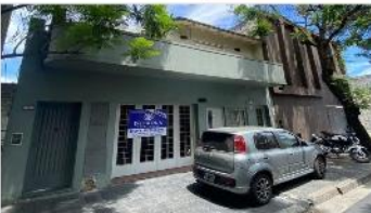
VILLA MARTELLI BLOCK 2 PH de 3 Amb

Block con 2 unid PH 3 amb con tza, ubicado en PB y PA, exc ubicación, a mts de av, 171m2 cubiertos, sin expensas, (DEPA2214)