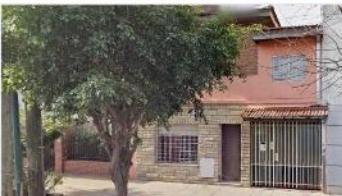
VILLA MARTELLI Chalet 4 Amb

Chalet 4 ambientes con garage, refaccionado, 139m2 cubiertos, muy buena ubicacion; a metros Avenida Laprida, (DEPA2331)