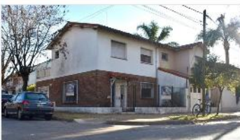
FLORIDA Casa 3 Amb

Casa 3 ambientes con 125m 2 cubiertos, lote 130m 2 , garage, terraza, a metros Av San Isidro, (DEPA2328)