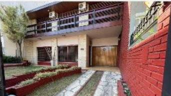
BARRIO CAESITA Chalet 6 Amb.

Chalet 6 amb a metros avenida mitre 240m2 cubiertos s/lote 345m2, jardin, piscina, quincho 3 dormitorios, 3 baños (DEPA2442)