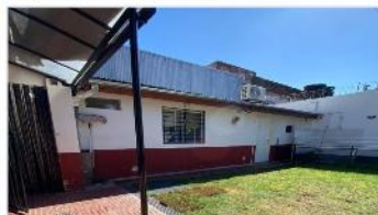
VILLA MARTELLI PH 3 Amb

PH 3 AMBIENTES con JARDIN, refaccionado en su totalidad, 95m2 cub, 2 dorm, baño comp, hermosa cocina comedor, (DEPA2254)