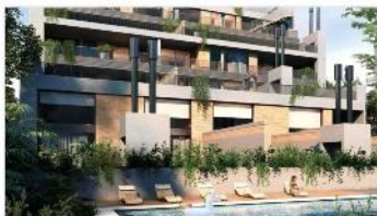
OLIVOS Depto 2 amb

En pesos!! A estrenar, edificio "vita" a metros de avda maipu y ugarte, balcon , 65m2 , excelente ubicación,. (DEPA1714)