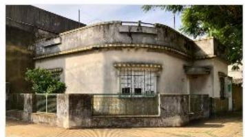
BARRIO CALESITA Casa 4 amb

Casa 4 ambientes con terreno 170m 2 , 110m 2 cubiertos, garage, terraza, a metros AvenidaMitre, (DEPA2454)