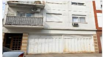
BARRIO PARQUE Depto 2 Amb.

Zona quinta residencial, 44m2 CUB , A metros avenida, excelente estado, refaccionado, bajas expensas (DEPA1745)