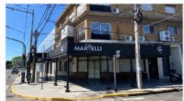
VILLA MARTELLI FONDO DE COMERCIO

Unico local gastronomico en venta! Reconocida hamburgueseria y pizzeria, s/ av Mitre, funcionando. Valor fondo de comercio (DEPA2414)