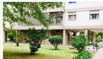
BARRIO PARQUE Depto 4 Amb.

60m2 CUB + Balcon ,cochera , muy luminoso, exc. Estado y ubicación (DEPA1547)