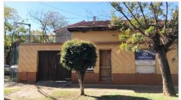
FLORIDA Casa 3 Amb + Local

Casa 3 ambientes + local, lote 170m2 con 110m2 cubiertos, patio, Garage, (DEPA2073)