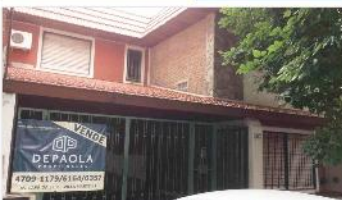
FLORIDA M Chalet 4 Amb

Chalet 4 amb zona colegio la salle con 200m2 cub. 3 dormitorios patio quincho garage (DEPA1652)