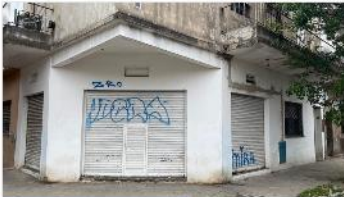
VILLA MARTELLI Local + Monoamb

Block compuesto por Monoamb + Local en esquina, 42m2 Cub, Doble Entrada Independen Ideal pequeño inversor / Vivienda; (DEPA2402)