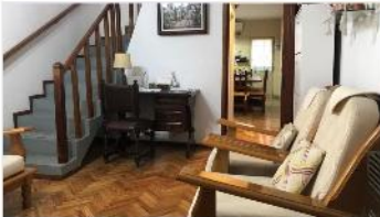
VILLA MARTELLI Casa 4 Amb.

Casa 4 Amb 115m2 cubiertos, 3 dorm, Pisos de Madera, Amplia coc cdor, Gge y Patio, Parrilla, Lav; Excelente Estado. (DEPA1972)