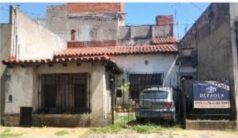
FLORIDA Casa Amb.

Casa 3 ambientes, lote 103m2, 88m2 cubiertos, cochera, patio, 2 dormitorios, terraza, ideal ampliacion, (DEPA1925)