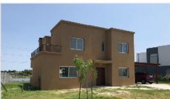
SAN GABRIEL Casa 4 Amb.

Casa 4 amb 3 años antigüedad s/lote 806m2 al "lago", coch, jardin, calef central B° San Gabriel – Villanueva (DEPA1825)