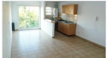
SAN ISIDRO Depto 2 Amb.

48m2 CUB + Balcon , a metros avenida Centenario , muy luminoso, bajas expensas. (DEPA2363)