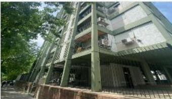
NUÑEZ Depto 2 Amb.

40m2 CUB + Balcon, al frente sobre boulevard Rivadavia, a metros Libertador