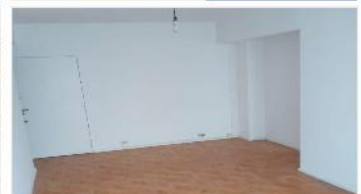
FLORES Depto 2 Amb.

A mts centro comercial "calle Avellaneda", 45m2 cub. 1 dorm, zona de mucho crecimiento economico optimos medios transporte. (DEPA2144)