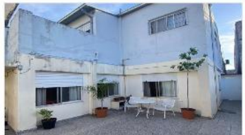
VILLA MARTELLI Block 2 PH 3 amb

BLOCK Compuesto por 2 viviendas 3 ambientes cada una, 145m2 cubiertos + patio y terraza, lavadero. (DEPA2466)