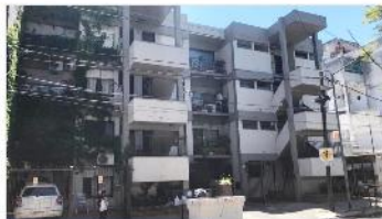
SAN ANDRES Depto 3 Amb.

REFACCIONADO, Muy buen estado 65m2 cubiertos, bajas expensas, PROXIMO ESTACION TREN Y AVENIDA DEPA1951