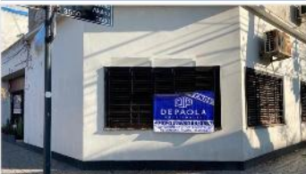
VILLA MARTELLI Casa 3 Amb.

90m2, REFACCIONADO, A METROS DE AVENIDA MITRE, Terraza, parrilla, IMPECABLE! DEPA2334