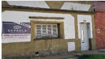
VILLA MARTELLI Casa 3 Amb.

Sobre lote 8,66x11, ideal refaccion / ampliacion / proyecto multifamiliar, a metros avenida. DEPA2058