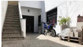
VILLA MARTELLI PH 4 Amb.

107m2 + Patio y terraza 3 dorm, cocina comedor, parrilla, A METROS AV. MITRE. DEPA1820