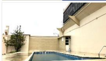
FLORIDA Loft 3 Amb.

75M2 con Cochera (opcional) Edificio con SUM, Piscina, Parrilla. DEPA2129