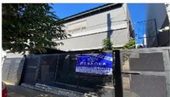
VILLA MARTELLI Block 2 Chalet

Compuesto Por 2 chalet (5 y 3 amb) entrada indptge, garage doble, EXC. UBICACIÓN Y ESTADO. DEPA2284