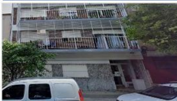
FLORES Depto 2 Amb.

En centro comercial de "calle Avellaneda", 45m2 , balcón, 1 dorm c/placard. Impecable. DEPA2144