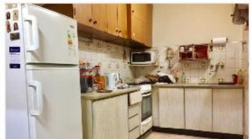
FLORIDA PH Multifamiliar

COMPUESTO POR 2 UNIDADES 3 Amb cada una, patio, sin expensas. DEPA1684