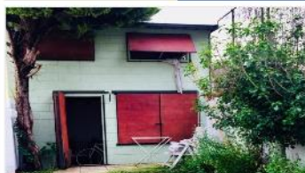
SAAVEDRA PH 3 Amb

Con jardín y quincho, excelente ubicación, A METROS AVENIDA, BAJAS EXPENSAS. DEPA1579