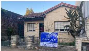
VILLA MARTELLI Chalet 3 ambientes

Chalet 3 Ambientes sobre Lote Propio 8,66x17 con 100m2 cub. 2 dormitorios cochera DEPA2391