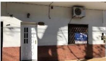
VILLA MARTELLI PH 3 Amb

REFACCIONADO, Ubicado en planta baja y al frente; A METROS DE AVENIDA MITRE Y LAPRIDA. DEPA1722