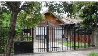
CARAPACHAY Casa 3 amb

EXCELENTE ESTADO, 6 AÑOS ANTIG. 3 DORM. (PRINCIPAL EN SUITE), PATIO, TERRAZA, ESCRITORIO. ZONA COLEGIO LA SALLE. DEPA2160