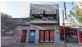
VILLA MARTELLI PH apto multifamiliar

200m2, 4 Dorm., garage, patio, terraza, quincho. DEPA1561