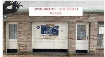
VILLA MARTELLI Casa 4 Amb

Sobre terreno 8,66x33, techo losa ideal ampliacion, apto duplex / galpon. ZONIF, I1 FOT 1,2. DEPA2097