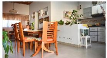
VILLA MARTELLI Casa 4 Amb.

CHALET 6 AMB 390m2 CUB. SOBRE TERRENO 650m2, UBICADO KM45,5 RAMAL PILAR. FORMA DE PAGO: Anticipo u$s 190.000 + Cuotas en Pesos EXPENSAS $65.000. DEPA2356