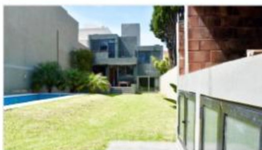
FLORIDA M Casa 6 Amb.

200m2 Cub. Lote 8,66x50, 4 años antig. Jardín, piscina, parrilla, galería. DEPA1670