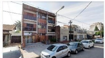
VILLA BALLESTER Depto 2 Amb.

Amplio 2 amb con balcon , vista contrafrente Pulmon de Manzana, a metros Avenida Alvear, bajas expensas DEPA1810