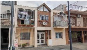
SAAVEDRA PH 3 Amb.

TIPO LOFT, A Metros avenida, bajas expensas, al frente y muy luminoso. DEPA2043