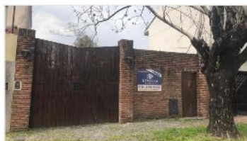
VILLA MARTELLI Terreno

8,66x35 Con quincho y piscina, zonif r2, fot 1 apto residencial multifamiliar A METROS CABA,