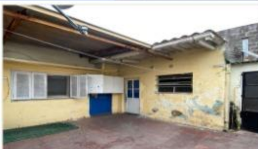
VILLA MARTELLI PH 2 Amb.

Con Patio, Ideal Refaccion, Espacio aéreo Propio. Ubicado s/ avenida Laprida y chile. DEPA2121