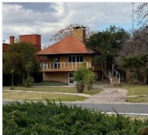
VENTA C.C. LOS LAGARTOS – PILAR - FINANCIACION DIRECTA