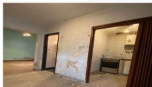
VILLA MARTELLI PH 2 Amb.

Con patio, sin expensas, posibilidad de convertirlo en 3 amb. DEPA2353