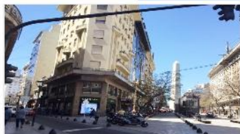
CENTRO Apto prof.

Semipiso apto profesional , 75m2 cub., 3 oficinas privadas + sala de reunion, baño privado. DEPA2327