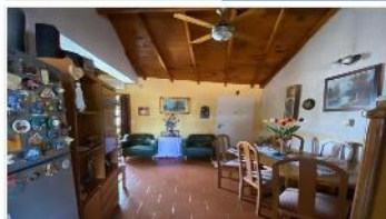
SAN MARTÍN PH 4 Amb.

Con terraza y balcon, PROX. ESTACION Y CENTRO COMERCIAL. DEPA1626