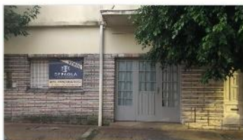
VILLA MARTELLI PH 3 Amb.

VENTA CON RENTA! 85m2 Cub. + patio, garage, MUY LUMINOSO! DEPA2039