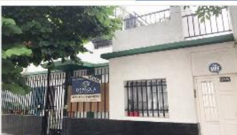
VILLA MARTELLI Casa 4 Amb

REFACCIONADA, 130m2, Al frente e independiente, quincho, terraza, patio, A MTS AVENIDA Y ESTACION. DEPA2004