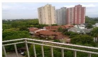
BARRIO PARQUE Depto 4 Amb.

60m2, balcón con hermosa vista abierta, cochera, 3 dorm, cocina indpte, lavadero. DEPA1547