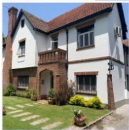
CHALET ESTILO INGLES 7 AMB, 500m2 CUB.