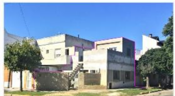
VILLA MARTELLI PH Refaccionado a nuevo

60m2 Cub. + patio + terraza; MUY BUENA UBICACIÓN. DEPA2287