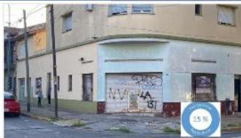
VILLA MARTELLI Block PH 4 amb + Local

Excelente a metros avenida y subte, muy luminoso; 40m2 , bajas expensas. DEPA2288