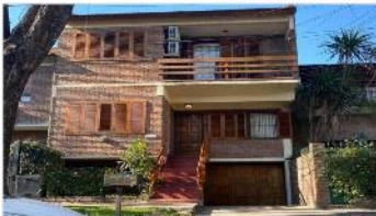
BARRIO PARQUE Chalet 5 Amb.

150m2 Cub., garage subsuelo, cochera, 4 dorm, dep. Servicio, patio, parrilla. EXC. UBICACIÓN. DEPA2337