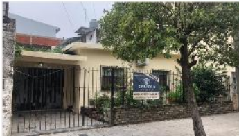
VILLA MARTELLI Casa 3 Unidades.

Casa ideal inversor, compuesto por 3 unidades (3 y 2 amb) ideal ampliacion, cochera varios autos. Terreno 10X20. DEPA2053