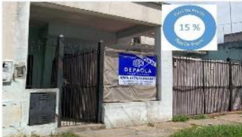
SAN MARTIN Block 2 Unidades

Block 2 unidades de 3 amb cada una, lote 8,66x29 y 145m2 cub. VALOR LOTE! DEPA2217