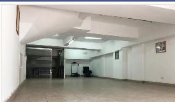
VILLA MARTELLI Local sobre Av. Mitre

110m2 CUB. EXCELENTE ESTADO, Persiana elevadiza. 2 BAÑOS. DEPA1749