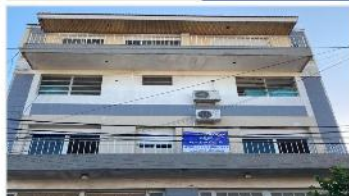
VILLA MARTELLI Apto profesional

Departamento, 140m2 CUB., SIN EXPENSAS, A METROS AVDA LAPRIDA. EX RUBRO ODONTOLOGICO. DEPA2255