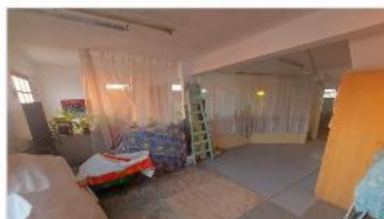
VILLA MARTELLI PH apto profesional

Ex estudio danza, 102m2 cub., 2 dormitorios, SIN EXPENSAS. DEPA2274