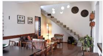
VILLA MARTELLI PH 4 Amb.

PB: DEPOSITO CON BAÑO (POSIBLE GARAGE) 41m2 + PA: PH 3 AMB CON BALCON AL FRENTE; 130M2 TOTALES, A METROS DE AVENIDA MITRE. DEPA2338