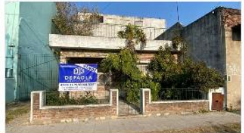
VILLA MARTELLI Casa 4 amb.

Sobre terreno 8,66x26 ideal ampliacion / refaccion, zonif, i1 apto galpon. DEPA2308