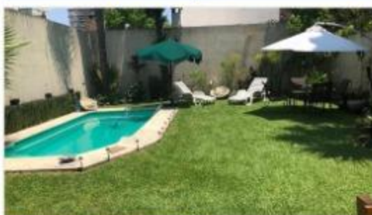
BARRIO PARQUE Chalet 6 Amb

350m2 Cub. Lote 9x35, 4 dorm, 6 baños, cochera doble, jardín piscina galería. DEPA1798