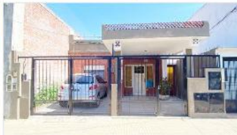
VILLA MARTELLI Casa 3 Amb

Casa 3 ambientes con cochera doble , patio y terraza, a metros de avda Laprida. DEPA2392