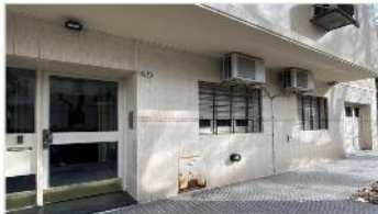
CABALLITO PH 2 Amb.

Con patio y garage, 67m2 totales, A METROS DE AVDA RIVADAVIA, ZONA PARQUE. DEPA2343