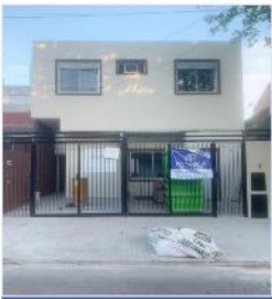
ULTIMA UNIDAD DISPONIBLE! ENTREGA OCTUBRE 2022!