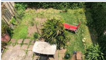
VILLA MARTELLI PH 3 Amb.

REFACCIONADO, al frente e independiente, 80m2 cub. Jardín 10x9, terraza IDEAL AMPLIACION. DEPA1961