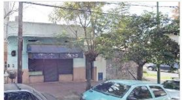
VILLA MARTELLI Venta en Block

Casa a mejorar + local sobre lote 15x15 IDEAL EMPRENDIMIENTO TIPO DUPLEX. DEPA2378