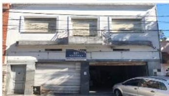
VILLA MARTELLI Block Galpon + Vivienda

A mejorar, 350m2 CUB. LOTE 8,66X46 ZONIF. I1 FOT 1,2. DEPA1974