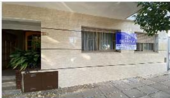
VILLA MARTELLI PH 2 Amb.

Con patio, 70m2 total, ubicado en planta baja y al frente, A METROS DE AVENIDA MITRE Y GENERAL PAZ. DEPA2295