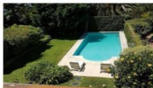
BARRIO PARQUE Chalet 7 Amb

400m2 Cub lote 10x39, dep. Serv, garage subsuelo, EXC. DETALLE TERMINACION. DEPA1968