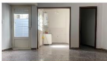
MUNRO PH 3 Amb.

A Metros Avda Ader, 2 dorm, patio, terraza, cocina indpte, SIN EXPENSAS. DEPA2171