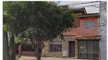
VILLA MARTELLI Casa 4 Amb.

Con garage, al frente e independiente, distribuida 2 plantas, A METROS AVENIDA.