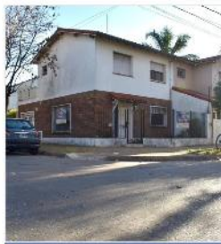
CHALET 4 AMB EN EXCELENTE UBICACIÓN