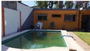
VILLA MARTELLI Casa 4 Amb

Con jardín piscina y quincho, terreno 10x30, muy buen estado, apto ampliacion. DEPA2249