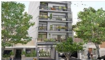
SAN MARTÍN Depto 2 Amb.

46m2 A ESTRENAR Con balcon , EXCELENTE UBICACIÓN Y CALIDAD CONSTRUCTIVA, A METROS AVENIDA, ESTACION TREN. DEPA2246