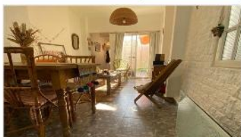
MUNRO PH 2 Amb

Refaccionado con patio, SOBRE AVDA VELEZ SARFIELD, A METROS ESTACION. DEPA2314