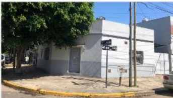
VILLA MARTELLI PH 3 Amb.

Con garage, terraza, 76m2 cub. , ideal refaccion, muy luminoso. DEPA2031