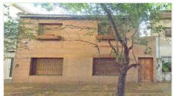
FLORIDA M Chalet 4 Amb

160m2 cub., lote 8,66X17, jardin y piscina, galeria, distribuido en 2 plantas, 200m de avenida maipu y san martin. Depa2299