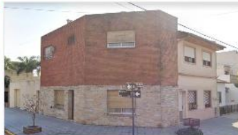
VILLA MARTELLI Block apto Multifamiliar

Compuesto por 2 casas independientes. EXCELENTE ESTADO . DEPA2401