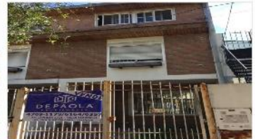
VILLA MARTELLI Chalet Dplx

4 Amb, 2 dorm, playroom, patio, cochera, 100m2 cub. DEPA2313