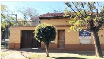
FLORIDA Chalet 3 Amb

Garage y cochera, patio, edificada s/ terreno 170m2, a metros avenida y estacion. DEPA2073