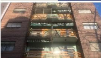
SAN MARTÍN Depto 3 Amb.

con Balcon, 65m2, Excelente estado y ubicación, zona plaza municipal. DEPA2360