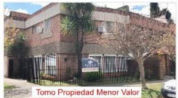
Tomo Propiedad Menor Valor