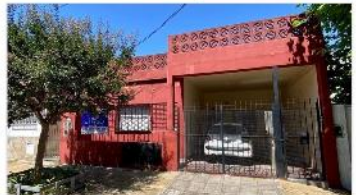
VILLA MARTELLI PH 3 Amb.

Con garage + patio + terraza, 249m2 propios, UBICADO AL FRENTE E INDEPENDIENTE. DEPA2197