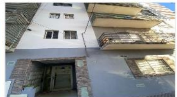
VILLA BALLESTER Depto 2 Amb.

con Balcon, al frente , 40m2 , living con cocina integrada, lavad. , dorm c/placards, baño completo. DEPA2316