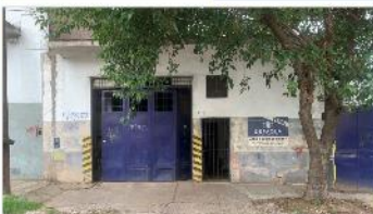
VILLA MARTELLI Galpón industrial

300m2 CUB. + 55M2 Libres, techo losa preparado para construir 2 unidades. TERRENO 8,66x41. DEPA2232