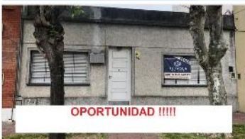
VILLA MARTELLI Casa 3 Amb

Sobre terreno 8,66x17,5, techo losa, ideal ampliacion, proximo avda mitre, estacion tren. DEPA1930