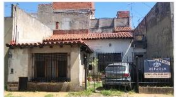
FLORIDA CASA 3AMB

Sobre terreno 8,66x12, patio, terraza (30m2 IDEAL AMPLIACION) Cochera. DEPA1925