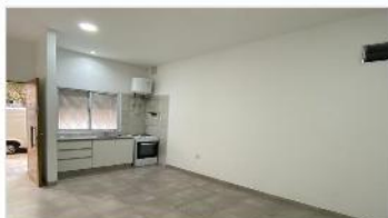
VILLA MARTELLI Block 2 Oficinas

BLOCK COMPUESTO POR 2 OFICINAS INDEPENDIENTES, A LA CALLE, SIN EXPENSAS. REFACCIONADAS. DEPA2265