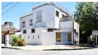
SAAVEDRA PH 2 Amb

+ Garage y patio, al frente e independiente. A METROS DE GENERAL PAZ, AVENIDA. DEPA1580