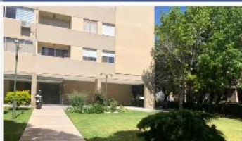
BARRIO PARQUE Depto 3 Amb.

55m2, balcón, 2 dorm, baño completo, lavad. Cub. Bajas Expensas. DEPA1958