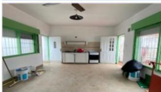
VILLA MARTELLI PH 4 Amb

122m2 , 3 dorm, 2 baños, patio, lavadero, espacio aéreo propio, oportunidad. DEPA1728