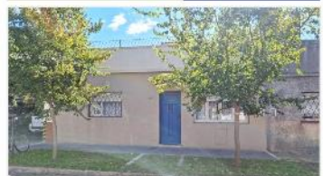
VILLA MARTELLI Casa 4 Amb.

AMB REFACCIONADA, A metros avenida mitre y estación tren, patio + terraza. EXCELENTE ESTADO. DEPA2279