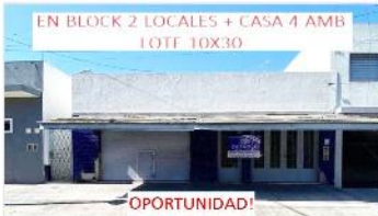
VILLA MARTELLI BLOCK 2 LOCALES + CASA

Casa 3 amb con jardin, terreno 10x30, techo losa IDEAL AMPLIACION / INVERSION. DEPA2253