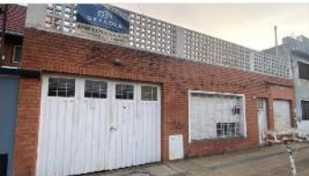
VILLA ADELINA Casa 4 Amb.

Sobre terreno 10x32, apto duplex, ampliacion, jardin 10x20, A METROS AVENIDA. DEPA2296