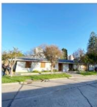
CHALET 5 AMB SOBRE IMPORTANTE TERRENO 735m2