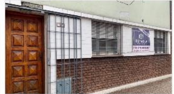
VILLA MARTELLI Casa 3 Amb

Sobre terreno 133m2, techo losa ideal ampliacion, A METROS DE AVENIDA. DEPA2122