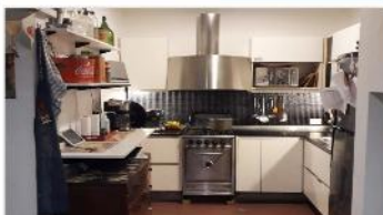
FLORIDA M PH 3 Amb

83m2 Cub. + terraza, refaccionado, 2 dorm., Baño completo, cocina con mobiliario completo. DEPA2281