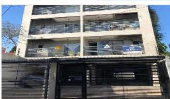
FLORIDA Depto 2 Amb.

C/ Cochera fija, 52m2 , balcon, edificio con sum, terraza. DEPA2315