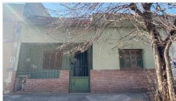
VILLA MARTELLI PH Tipo Casa 3 Amb

80m2 2 Dorm, baño,patio, terraza, ideal ampliacion /refaccion , A METROS DE AVENIDA LAPRIDA. DEPA2347