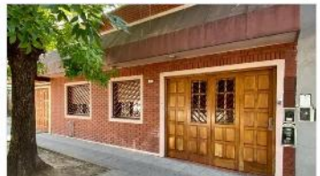
VILLA MARTELLI Block 4 unidades

Casa 4 amb + taller + dpto 2 amb a terminar, 190m2 cub., garage, terreno 188M2. DEPA2215