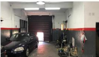
VILLA MARTELLI Zona industrial

APTO VARIOS RUBROS - Actualmente taller, 70m2 cub., baño, persiana elevada, MUY BUENA UBICACIÓN. DEPA1948