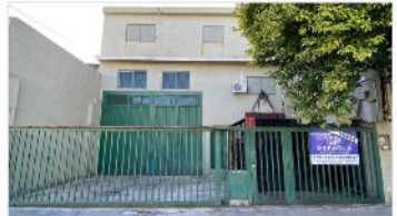
VILLA MARTELLI Inmueble Industrial

Con oficinas, cocheras s/lote 10x50 con 453m2 cubiertos - POSIBILIDAD DE AMPLIACION. DEPA2145