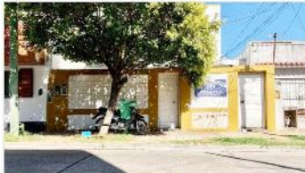
VILLA MARTELLI Block 4 unidades

Compuesto por 4 unidades de 2 y 3 amb, 250m2 cub. Sobre terreno 8,66x22, IDEAL INVERSOR!. DEPA2041