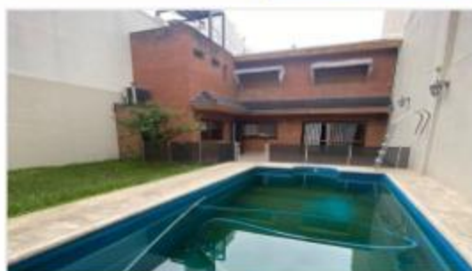
COGHLAN Chalet 6 Amb

300m2 Cub. Lote 8,66x38, jardín piscina, 4 dorm, playroom, garage doble, sistemas centrales. DEPA2335