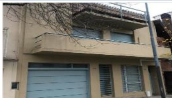
COGHLÁN PH 3 Amb.

60m2, REFACCIONADO, Patio, a metros de avenida , EXCELENTE UBICACIÓN. DEPA2089