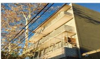
VILLA BALLESTER Depto 3 Amb.

con Balcon, a metros centro comercial, 4 años antigüedad, bajas expensas. DEPA1729