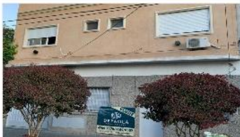
VILLA MARTELLI Block 4 unidades

Compuesto por 4 unidades (2 con 2 amb, 3 amb + deposito), 260M2 cub. Terreno 10X26. IDEAL INVERSOR. DEPA1840