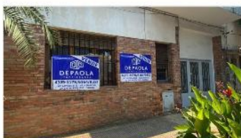
FLORIDA M PH 2 Amb.

SIN EXPENSAS, EXCELENTE UBICACIÓN. 36m2 CUB. DEPA2219