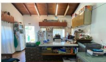
VILLA MARTELLI PH 3 Amb.

SIN EXPENSAS, EXCELENTE UBICACIÓN, 65m2 CUB + TERRAZA. OPORTUNIDAD. DEPA2282