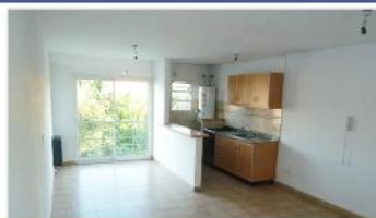
SAN ISIDRO Depto 2 Amb.

C/ cochera, ubicado a metros de avda centenario y estación tren , DEPA2363