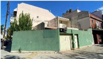
MONTECASTRO Casa 4 Amb

Amb en esquina sobre terreno 115m2, cochera cubierta, patio + terraza, A METROS AVENIDA. DEPA2283