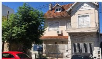
VILLA MARTELLI Chalet 5 Amb

270m2 cub. Lote 8,66X34, Jardin , Piscina, Quincho, Garage, 4 dorm, 3 baños. DEPA2002