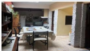
VILLA MARTELLI PH 4 Amb.

Refaccionado, 75m2 cubiertos + terrazas, sin expensas, 3 dorm, baño compl. Cocina indpte. DEPA2024