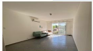
VICENTE LOPEZ Depto MonoAmb.

Sobre Av. Del Libertador alt. Arenales, Refaccionado, Balcon Frances, Cocina Indpte.; 44m2. DEPA2208