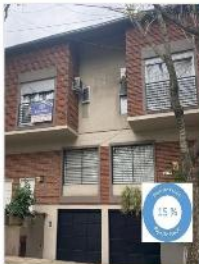
CHALET DUPLEX 5 AMB CON GARAGE EN SUBSUELO PARA 2 AUTOS