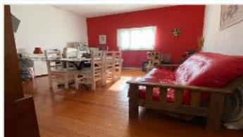
VILLA MARTELLI PH 3 Amb.

REFACCIONADO, 94m2 Cub + terraza y balcón, amplia cocina comedor, pisos madera, A METROS DE AVENIDA. DEPA2326