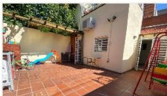
FLORIDA PH 3 Amb.

REFACCIONADO, Amplio patio, muy luminoso, 2 dormitorios, cocina indpte. DEPA2270