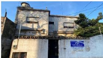
VILLA MARTELLI Block a reciclar valor lote!

S/ LOTE 8,66x23,30, UBICADO A METROS DE AVENIDA LAPRIDA. OPORTUNIDAD . DEPA2369