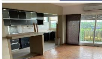
OLIVOS Depto 2 Amb.

REFACCIONADO EN SU TOTALIDAD POR ARQUITECTOS; PISO MADERA EN T/LOS AMBIENTES, CALDERA, AIRE ACONDICIONADO INDIVIDUAL, OPORTUNIDAD. DEPA2273