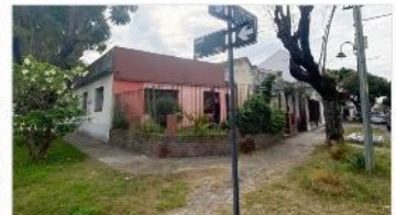
VILLA MARTELLI Casa 4 Amb

Sobre terreno 188m2, ideal ampliacion , fot 1,2 zonif i1, cochera. DEPA2319