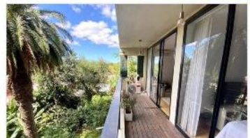
TIGRE Depto 2 Amb.

Hermoso Muy Luminoso, 45m2, Balcon Corrido con Vista abierta Palmeras. DEPA2306