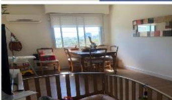
BARRIO PARQUE Depto 4 Amb.

Refaccionado, 57m2 cub. , excelente ubicación , Jardines perimetrales, bajas expensas. DEPA1931