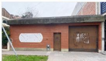
VILLA MARTELLI Inmueble Industrial

Lote 10x30 ex pyme elementos de medicion, IDEAL AMPLIACION, ZONIF I1 FOT 1,2. DEPA2324