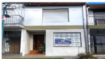
FLORIDA Duplex 4 Amb

EXCELENTE UBICACIÓN, 3 dorm, baño+toilette, patio, A METROS AVENIDA Y ESTACION TREN. DEPA2118