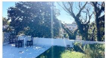
FLORIDA PH 4 Amb.

75m2 + Patio + terraza, refaccionado, a metros estación tren y avenida. Cafet. Central. DEPA2172