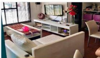
VILLA MARTELLI PH 3 Amb.

Distribuido en 3 plantas, baño completo + toilette, terraza, lavadero, REFACCIONADO.