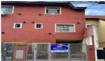
OLIVOS Chalet 4 Amb.

102m2 Cub. 3 dorm (2 suite), cochera, patio, parrilla. VENTA CON RENTA. DEPA2222