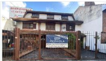
FLORIDA Chalet 4 Amb

120m2 CUB., COCHERA, JARDIN, GALERIA, PLAYROOM, ZONA LA SALLE. DEPA1606