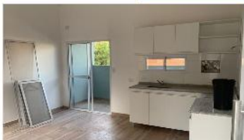
3 DE FEBRERO Depto 3 Amb.

A estrenar, 55m2, prox. Estaci3n fcc, avenida, bajas expensas. DEPA2184