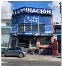
SOBRE COLECTORA PANAMERICANA LADO CABA