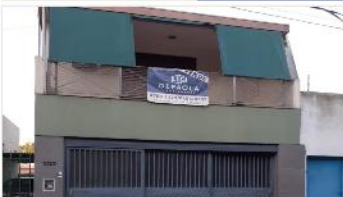
FLORIDA PH 4 Amb.

3 Dormitorios, 115m2, Garage doble, terraza, patio, quincho. DEPA1972