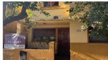
VILLA MARTELLI Chalet 5 Amb

160m2 Cub. 4 dorm (princ. En suite), patio, quincho, A METROS AVENIDA LAPRIDA Y MITRE. DEPA2103