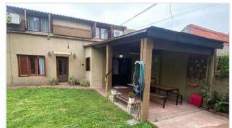
VILLA MARTELLI MULTIFAMILIAR

Block con 2 unidades con 2 y 4 ambientes, Lote 8,66x35, Gran Jardín, Cochera varios autos, Entradas Independientes (DEPA2571)