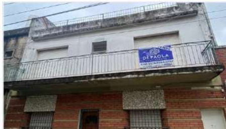
VILLA MARTELLI MULTIFAMILIAR Compuesto por 2 Unidades con 3 Ambientes cada una, patio y Terraza. Oportunidad! (DEPA2479) U$S 120.000