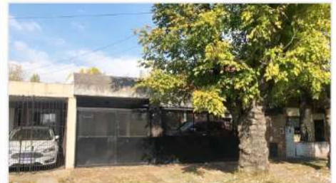
VILLA MARTELLI Casa 4 amb 4 Ambientes con 170m2 cub. sobre lote de 300m2, jardín, cochera 2 autos, ideal ampliación (DEPA1869) U$S 115.000