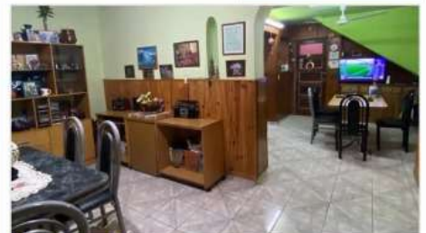
VILLA MARTELLI PH 4 Amb.

En PB, 4 Ambientes , 75m2, sin expensas, zona Boulevard Cetrangolo, Muy buen estado (DEPA2383)