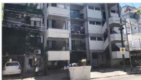
SAN ANDRES Depto 3 Amb

3 Ambientes, 65m2 , bajas expensas, Proximo estación tren, colectivos y centro comercial (DEPA1951)