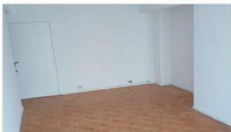
FLORES Depto 2 amb

2 amb a metros de Conocida Calle Comercial "Avellaneda", acceso por ascensor, balcón con cerramiento (DEPA2144)