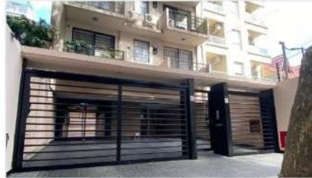
FLORIDA M COCHERA

A metros de Avenida Maipu, 1er subsuelo, acceso por montacarga, Edificio 20 años antigüedad (DEPA2269)