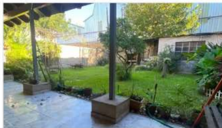
VILLA MARTELLI Casa 3 Amb

3 Ambientes, 2 dormitorios, Lote 10x23,57; Garage, Jardin, Galeria, Terraza, Ideal Ampliacion (DEPA2644)