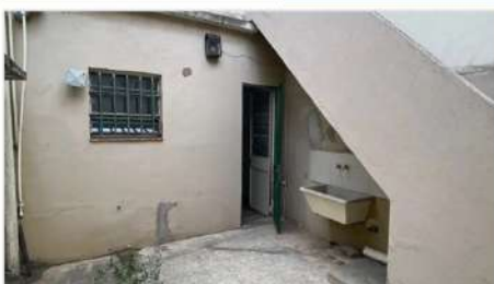
VILLA MARTELLI PH 2 Amb

2 Ambientes con Patio y Terraza, A metros de Av. Laprida , sobre calle Peru; Hermosa Ubicación! (DEPA2384)