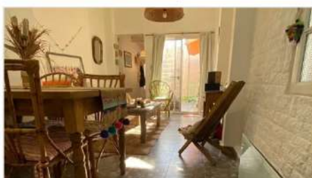
MUNRO PH 2 Amb

2 Ambientes con patio y balcon, sobre Avenida V. Sarfield, 78m2 totales, no paga expensas, muy cuidado (DEPA2314)