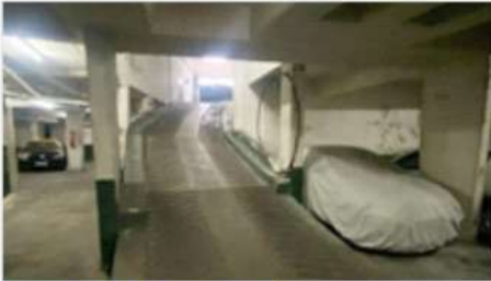
VILLA MARTELLI COCHERA

A metros de Avenida Mitre, acceso Por Rampa, Bajas Expensas, con Escritura (DEPA2598)