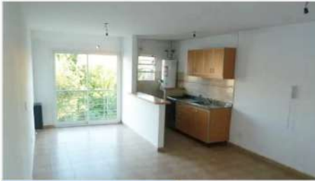
SAN ISIDRO Depto 2 Amb 2 Ambientes con Cochera, Hermosa Ubicación, a metros Avenida, bajas expensas, balcón (DEPA2363) U$S 110.000