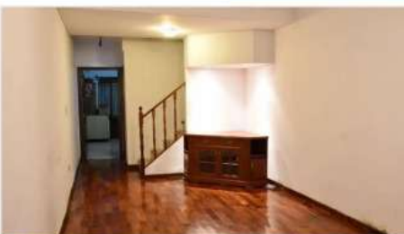
FLORIDA M Triplex 4 Amb.

4 Ambientes , 2 dormitorios + playroom , Cochera, Jardín, Galería, Zona colegio LaSalle (DEPA1606)