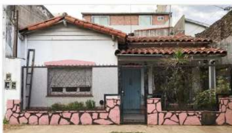
FLORIDA PH 3 Amb

Al frente e Independiente con Patio y terraza, A metros de Panamericana (altura Malaver) ideal Refaccion o ampliación (DEPA2457)