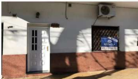
VILLA MARTELLI PH 3 Amb 3 Ambientes al frente e independiente, patio, a metros Avenida, Muy Buen Estado (DEPA1722) U$S 115.000