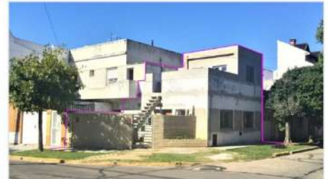
VILLA MARTELLI PH 2 Amb 2 Ambientes Refaccionado, Al frente e independiente, patio y terraza (DEPA2287) U$S 120.000