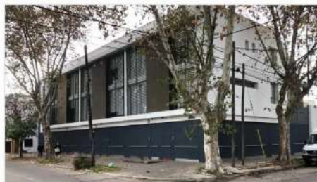
FLORIDA M Duplex 3 Amb.

3 Ambientes con posibilidad de generar 1 ambiente extra, Garage, Jardín, 2 baños, Muy Luminoso (DEPA2511)