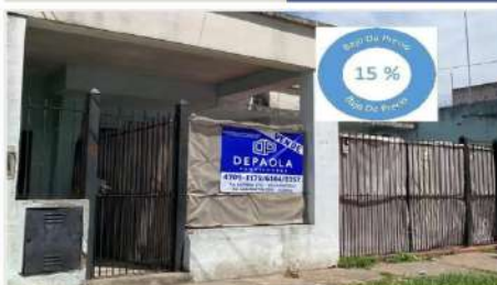
SAN MARTIN MULTIFAMILIAR

Block compuesto por 2 unidades con 3 amb cada una (frente y contrafrente) Entradas independientes (DEPA2217)