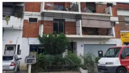
VILLA MARTELLI Depto 2 amb

2 Ambientes con Balcon, Sobre Avenida Mitre, a metros estación tren, 41m2 cub + 4 m2 balcon (DEPA2357)