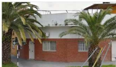
VILLA MARTELLI MULTIFAMILIAR

Block compuesto por 2 unid 3 amb. Cada una, Entradas independientes, 1 garage, Patio y terraza (DEPA1620)