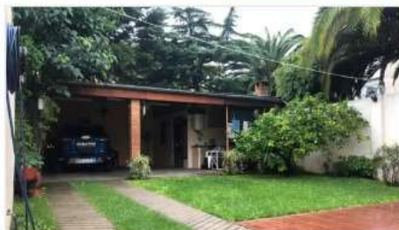
SAN ANDRES Casat 4 amb

4 Amb Refacionado! Lote 8,66x44, cochera varios autos, jardín, quincho, prox estación tren, muy buena ubicación (DEPA2049)