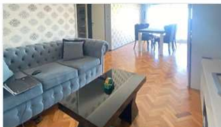
VICENTE LOPEZ Depto 2 Amb

2 Amb con Cochera Fija y Cub, Balcon, Vista al Rio, ubicado sobre Avenida Del Libertador - Toma Menor Valor!! (DEPA2003)