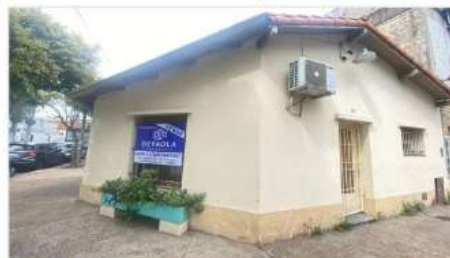
FLORIDA PH 3 Amb

2 ambientes Refaccionado a nuevo! Totalmente Independiente, muy buena ubicación, sin expensas (DEPA2520)