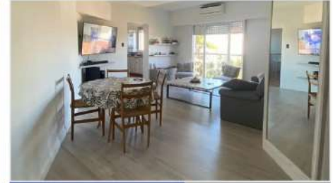
FLORIDA M Depto 2 amb 2 Amb Refaccionado en su totalidad! A mts Estacion Tren, Avenida y Centro Comercial, Piso Alto acceso Ascensor (DEPA2638) U$S 114.000