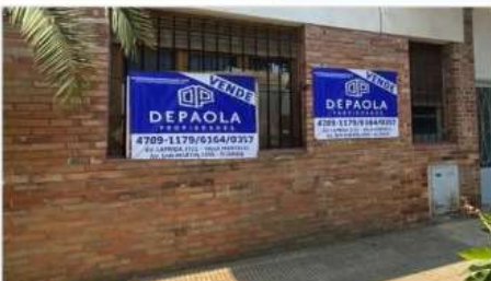
FLORIDA M PH 2 amb

En planta Baja con 2 ambientes, al frente, bajas expensas, próximo estación tren, General Paz (altura DOT) Oportunidad (DEPA2219)