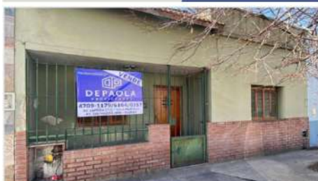
VILLA MARTELLI Casa 3 Amb

3 Ambientes a Refaccionar, 80m2 cub + patio y terraza, próximo Avenida Laprida, Oportunidad (DEPA2347)