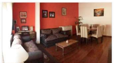
VILLA MARTELLI Casa 4 Amb

4 Ambientes, Lote 150m2, 3 dormitorios, Jardin, Piscina, Galeria, Terraza (DEPA2013)