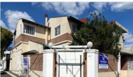
VILLA MARTELLI Casa 5 Amb.

5 Ambientes - 4 dormitorios, consultorio c/entrada indpte, Cochera, Excelente Ubicación (DEPA2244)