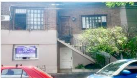
VILLA MARTELLI MULTIFAMILIAR

Block con 2 Unidades de 3 y 4 amb., Entradas Independientes, Jardin y terraza, Todos los servicios (DEPA2468)