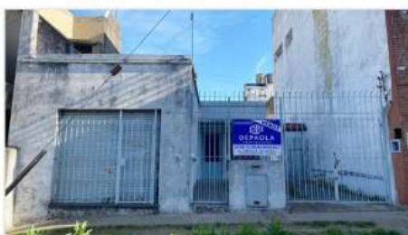
VILLA MARTELLI Casa 3 Amb

3 Ambientes con Jardín, Lote 8,66x31 zona i1, techo losa, apto Galpón / residencia (DEPA2553)