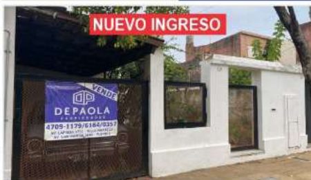
VILLA MARTELLI Casa 4 amb

4 Amb. desarrollado sobre poligono de 7,4x27 con 130m2, patio, terraza cochera cub. a metros avenida (DEPA2648)