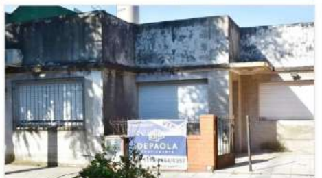
VILLA MARTELLI Casa 4 amb

4 Ambientes, Lote 163m2 con 90m2 cubiertos, Gran Patio, Terraza, Ideal Ampliacion (DEPA1673)