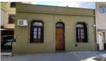
VILLA URQUIZA Casa 4 Amb

4 Ambientes, Lote 8,45x11 con 90m2 cub, Apto ampliación / emprendimiento, Hermoso Estado y Ubicación (DEPA2267)