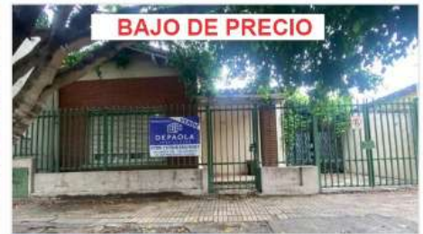
FLORIDA Casa 3 Amb

3 Ambientes sobre Lote 230m2 con 140m2 cub., Cochera, patio, ideal ampliación / refacción (DEPA2589)