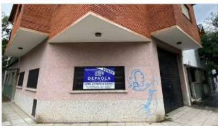
VILLA MARTELLI CASA + GALPON

BLOCK compuesto por CASA de 4 amb + GALPON con entrada vehiculo. (DEPA2450)