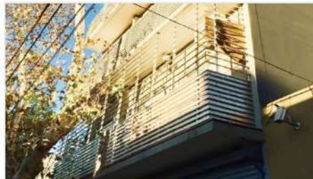
VILLA BALLESTER Depto 3 amb 3 Ambientes, Balcon corrido, 15 años antigüedad, bajas expensas, zona comercial (DEPA1729) U$S 115.000