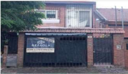
VILLA MARTELLI Duplex 6 Amb

Barrio Parque – 4 Ambientes con Cochera cub, jardín, Reciclado a nuevo! Excelente Estado y Ubicación (DEPA2036)