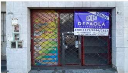
VILLA MARTELLI LOCAL

Sobre Avenida Laprida, 21m2 cub. Posee Vidriera, persiana, Baño; Oportunidad (DEPA2473)