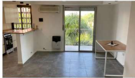
VILLA MARTELLI Depto 4 Amb. Barrio Parque - 4 Ambientes refaccionado, Cochera, Balcon, Todos los servicios (DEPA2257) U$S 110.000