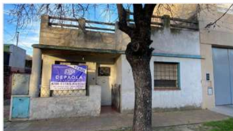
MUNRO Casa 4 Amb

PH 3 amb al frente con jardín y terraza, 108m2 totales, a refaccionar, próximo avenida mitre (DEPA2555)