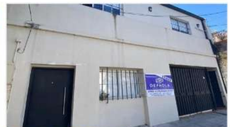
VILLA MARTELLI MULTIFAMILIAR

Compuesto por 3 unidades, 8 ambientes en total, garage, 350m2 cub. A metros avenida. (DEPA2193)