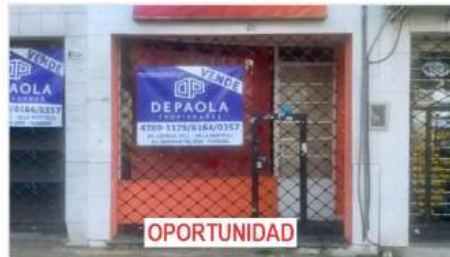
VILLA MARTELLI LOCAL

Sobre Avenida Laprida, 21m2 + jardin, baño, vidriera, persiana (DEPA2500)