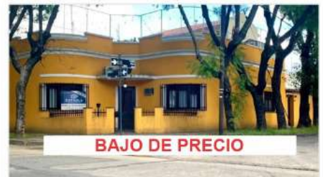
VILLA MARTELLI Casa 5 Amb.

5 Ambientes, 4 dorm. , Lote 275m2 con 196m2 cub., A metros de Avenida Laprida , Hermosa Ubicación (DEPA2022)