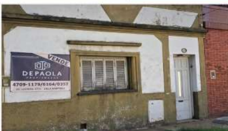
VILLA MARTELLI Casa 3 Amb.

A refaccionar, casa 3 amb en Lote de 95m2, a metros Avenida Laprida, Zona I1 (DEPA2058)