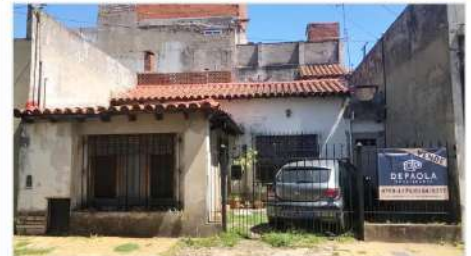
FLORIDA Casa 3 Amb. 3 Ambientes a mejorar, 80m2 cub. Con terraza (ideal ampliación), Lote 8,66x12. (DEPA1925) U$S 119.500