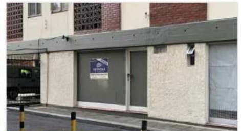
VILLA MARTELLI LOCAL

En Barrio Calesita, Local en Complejo de Torres, 30m2, baño , bajas expensas (DEPA1813)