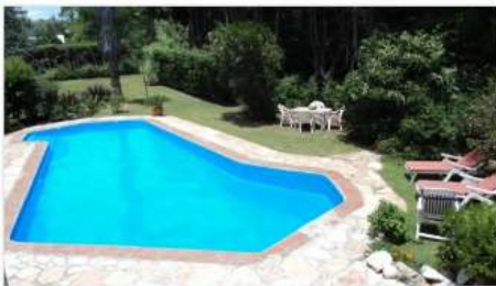
B° EL REMANSO Quinta

LOTE 3300m2 ARBOLADO CON PERIMETRO PROTEGIDO, CASA DE 350m2 CUBIERTOS, PISCINA, GALERIA, ACCESO POR ASFALTO (DEPA2256)