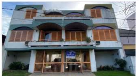
VILLA MARTELLI Triplex 5 Amb

Barrio Parque – 5 Ambientes, Garage, Jardin, Unico por su Diseño y Distribucion! A metros de CABA (DEPA2549)