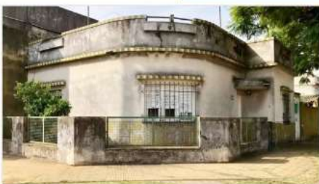
VILLA MARTELLI Casa 3 amb

Barrio Calesita - 3 ambientes con Garage, terraza y jardín – Ideal Refaccion, a metros de Avenida y panamericana (DEPA2454)