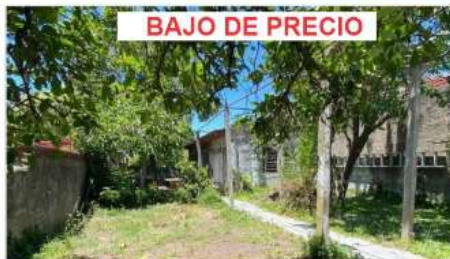
FLORIDA M MULTIFAMILIAR

Block con 2 unid 3 ambientes cada una + Gran Jardín; A metros de Estación tren y Avda General Paz. (DEPA2203)