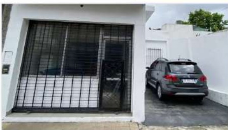
OLIVOS BLOCK En PH Local + Monoambiente + Cochera, zona comercial, Oportunidad! (DEPA1408) U$S 120.000