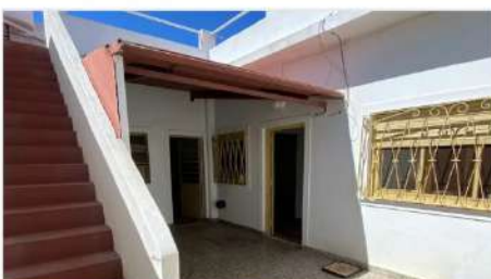
VILLA MARTELLI PH 2/3 Amb

Al Contrafrente, 2/3 ambientes, patio + terraza, lavadero, no paga expensas, Oportunidad! (DEPA2606)