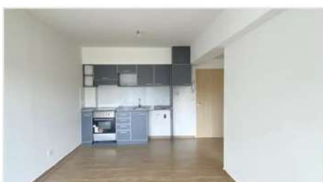
FLORIDA Depto 2 Amb

A Estrenar 2 Ambientes + Cochera, 45m2, Balcon, Terraza, SUM, Parrilla, A metros Avenida (DEPA2634)