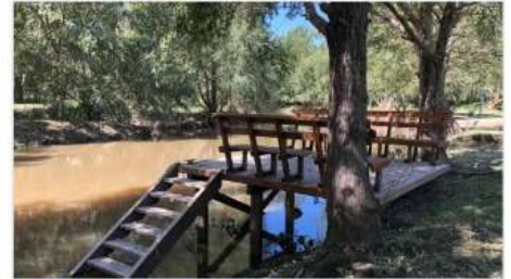
DELTA TIGRE LOTE

B° PALMARES DEL DELTA, 800m2 Con mejoras, muelle, playa, desmalezado, barrio con seguridad, piscina y resort (DEPA2610)