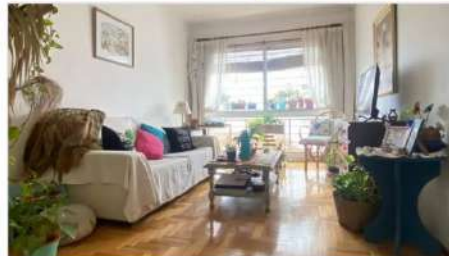
VICENTE LOPEZ Depto 4 Amb. 4 Ambientes sobre Av. Maipu, 2 Baños, Muy Luminoso, acceso por ascensor, zona Metrobus (DEPA2570) U$S 119.000