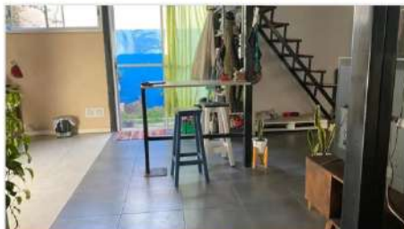
FLORIDA PH 3 amb Moderno 3 Ambientes con Jardín y Galeria, Zona "Florida Club", a metros estación tren (DEPA2393) U$S 117.000